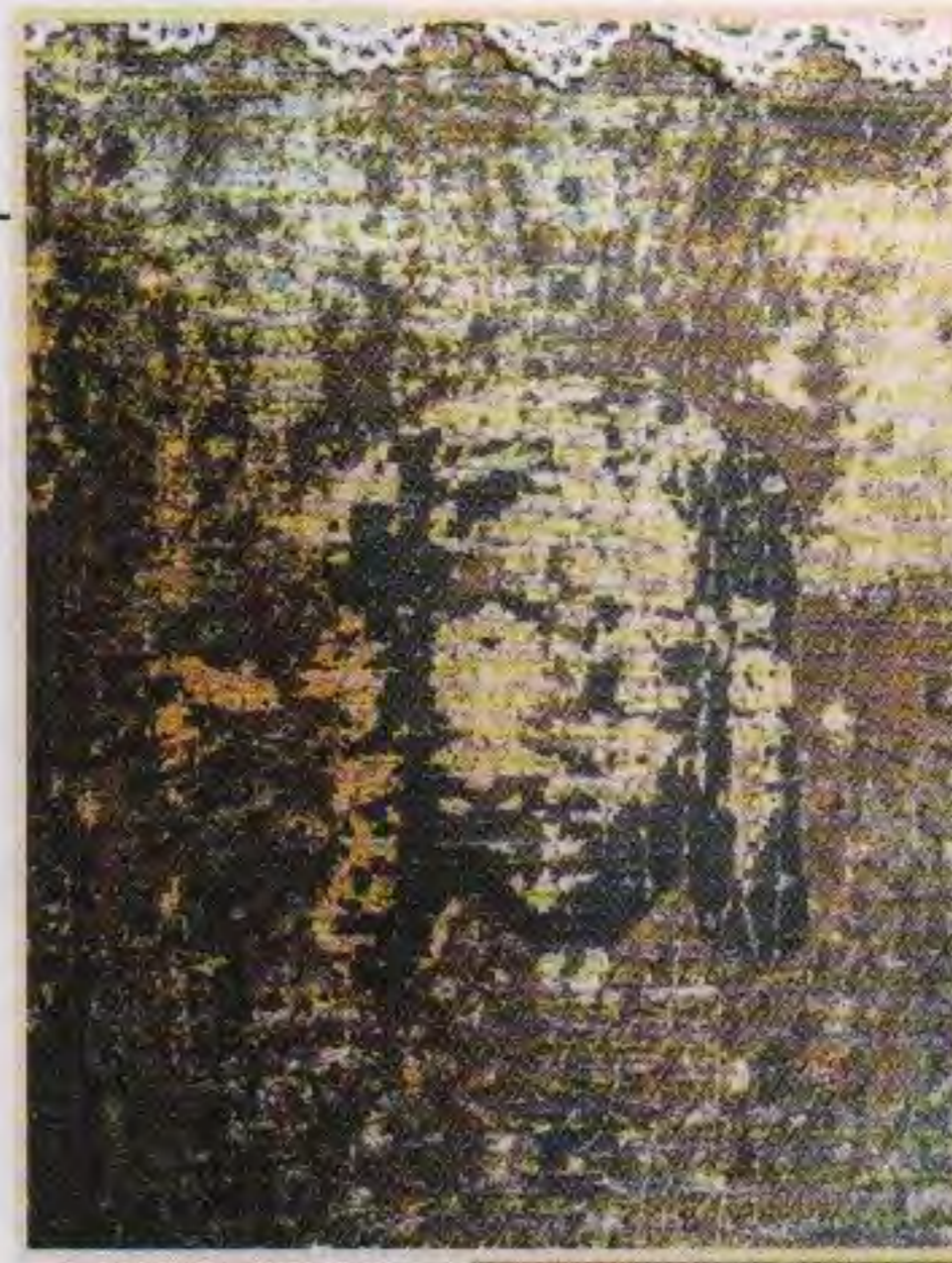
Явленная на роднике ико