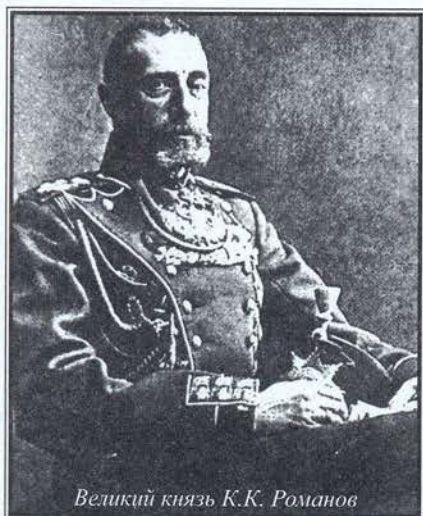
Великий князь К.К. Романов

Летом 2006 года В. Кочетков доставил в Ульяновск из США книгу «Честь» Георгия Ишевского, рассказывающую в форме мемуарных очерков о жизни симбирян первых десятилетий XX века. Сам автор покоится на Сербском кладбище в Сан-Франциско. О нем узнать почти ничего не удалось. В этом номере журнала мы решили опубликовать главу из книги, касающуюся Симбирского кадетского корпуса.