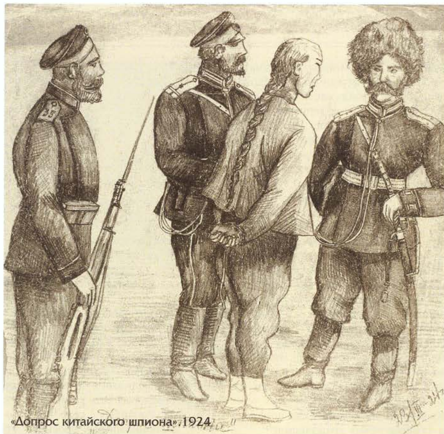
«Допрос китайского шпиона», 1924