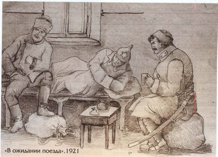
«В ожидании поезда». 1921