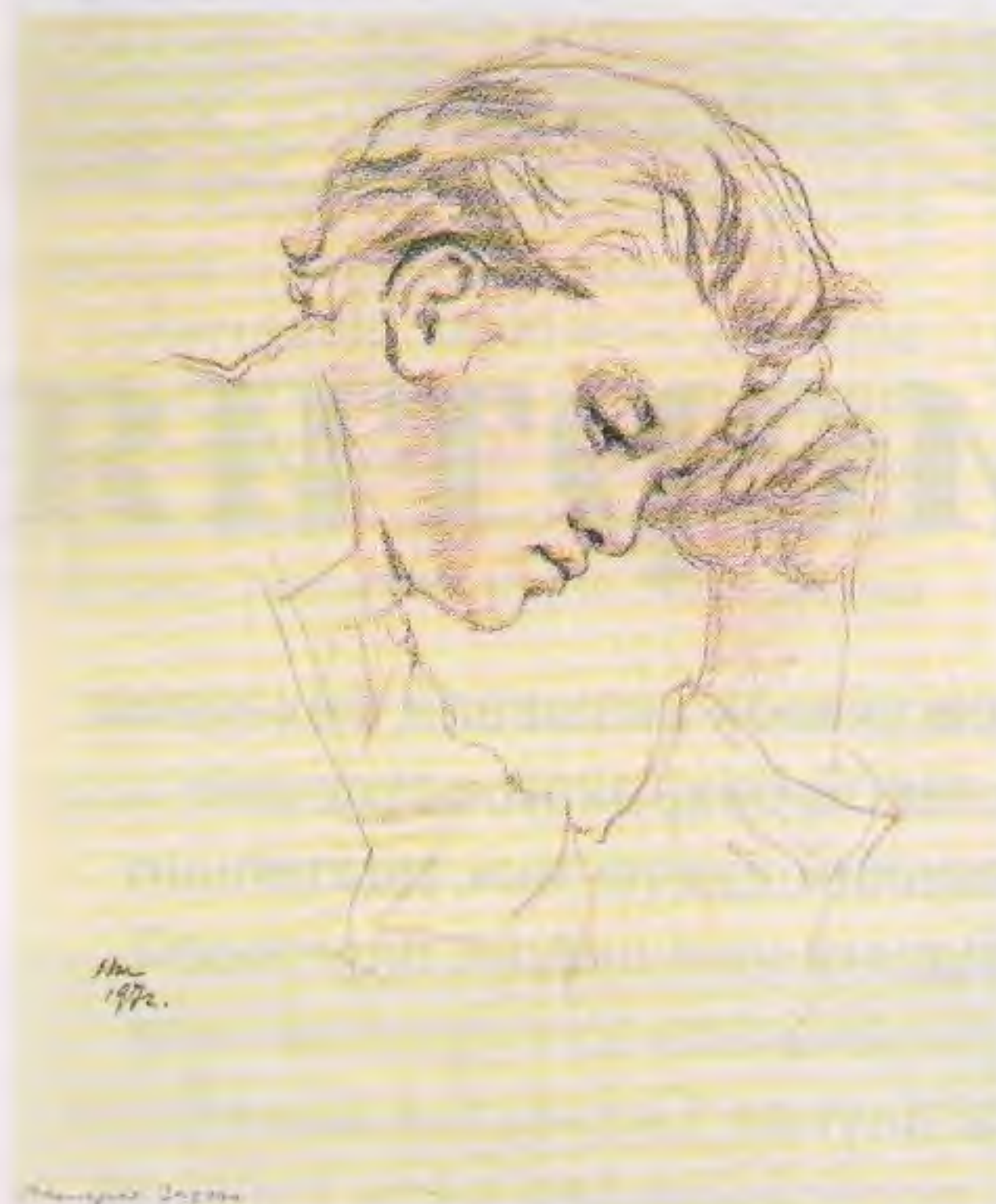
Жуков Николай Николаевич (1908–1973). Шахматная задача. 1972. Бумага, карандаш. УОХМ