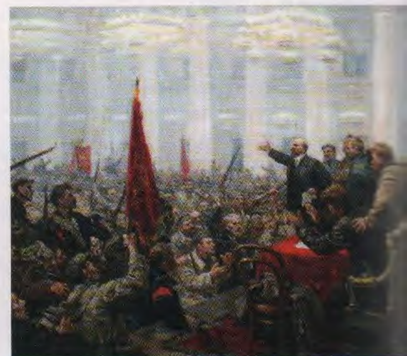
Серов Владимир Александрович (1910–1968). В.И. Ленин провозглашает советскую власть. Эскиз. 1947. Холст, масло. УОХМ