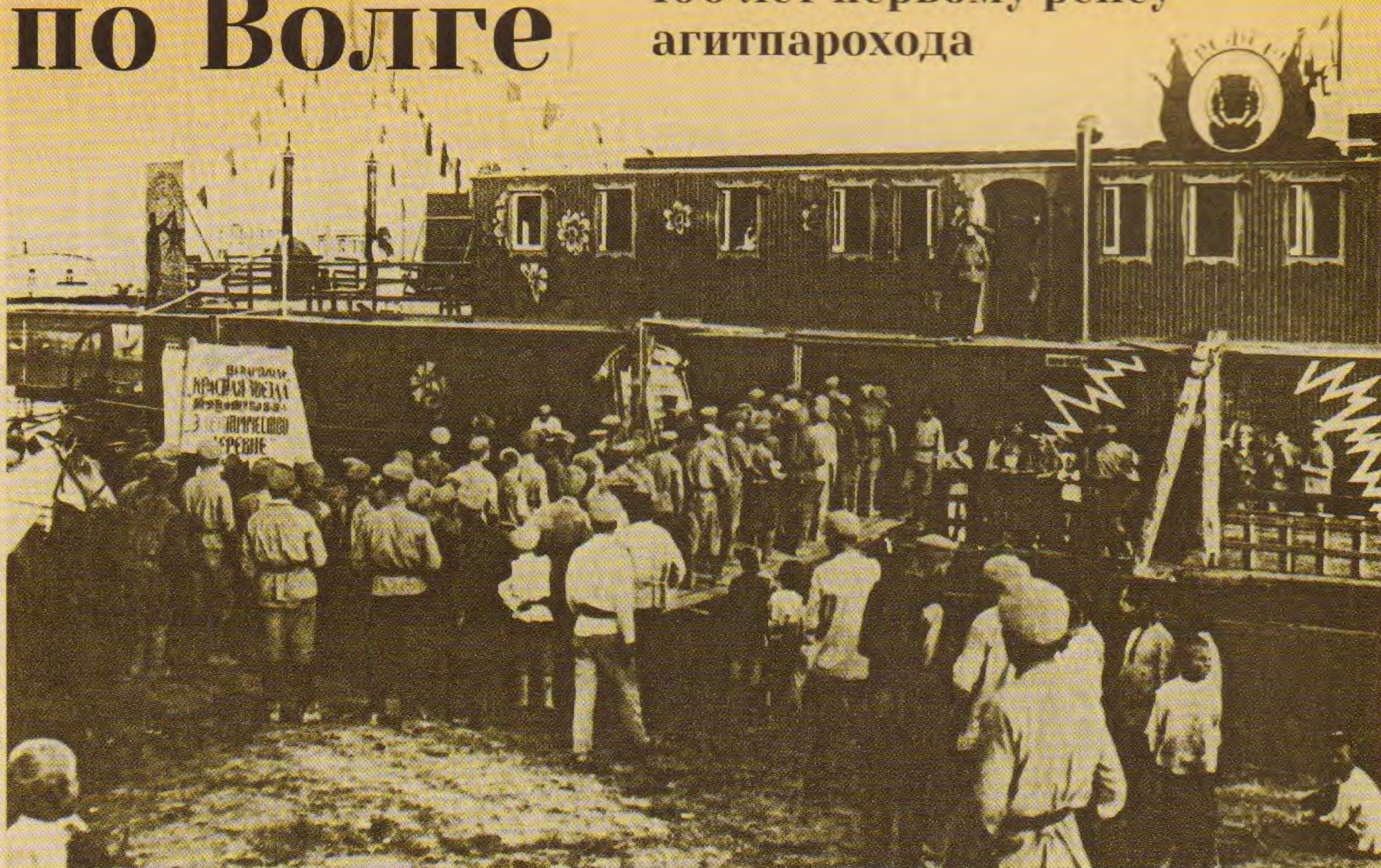
Агитпароход «Красная Звезда» в Саратове. XX век

100 лет назад, в июле–октябре 1919 года, по Волге и Каме прошел пароход. Он вышел из Нижнего Новгорода 4 июля. У судна было революционное название «Красная Звезда» и революционные задачи.