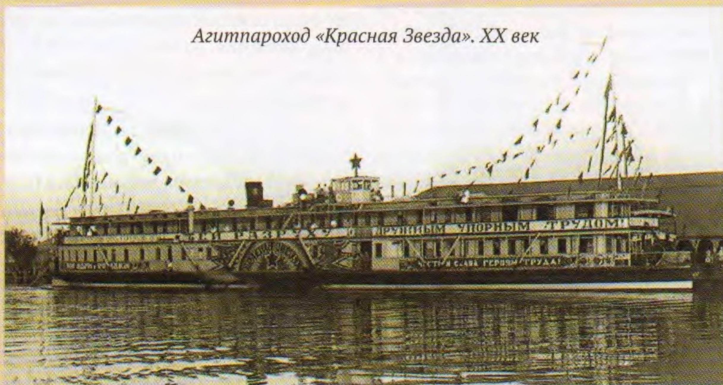
Агитпароход «Красная Звезда». XX век

Новая революционная вера в большевистские идеи, в светлое будущее должна была проникнуть в сознание красноармейцев, рабочих и крестьян, заменив веру в бога. Надежда Крупская, инструктор от Наркомпроса на пароходе, писала, что солдаты, с которыми она познакомилась в пути, передали ей слова священника: