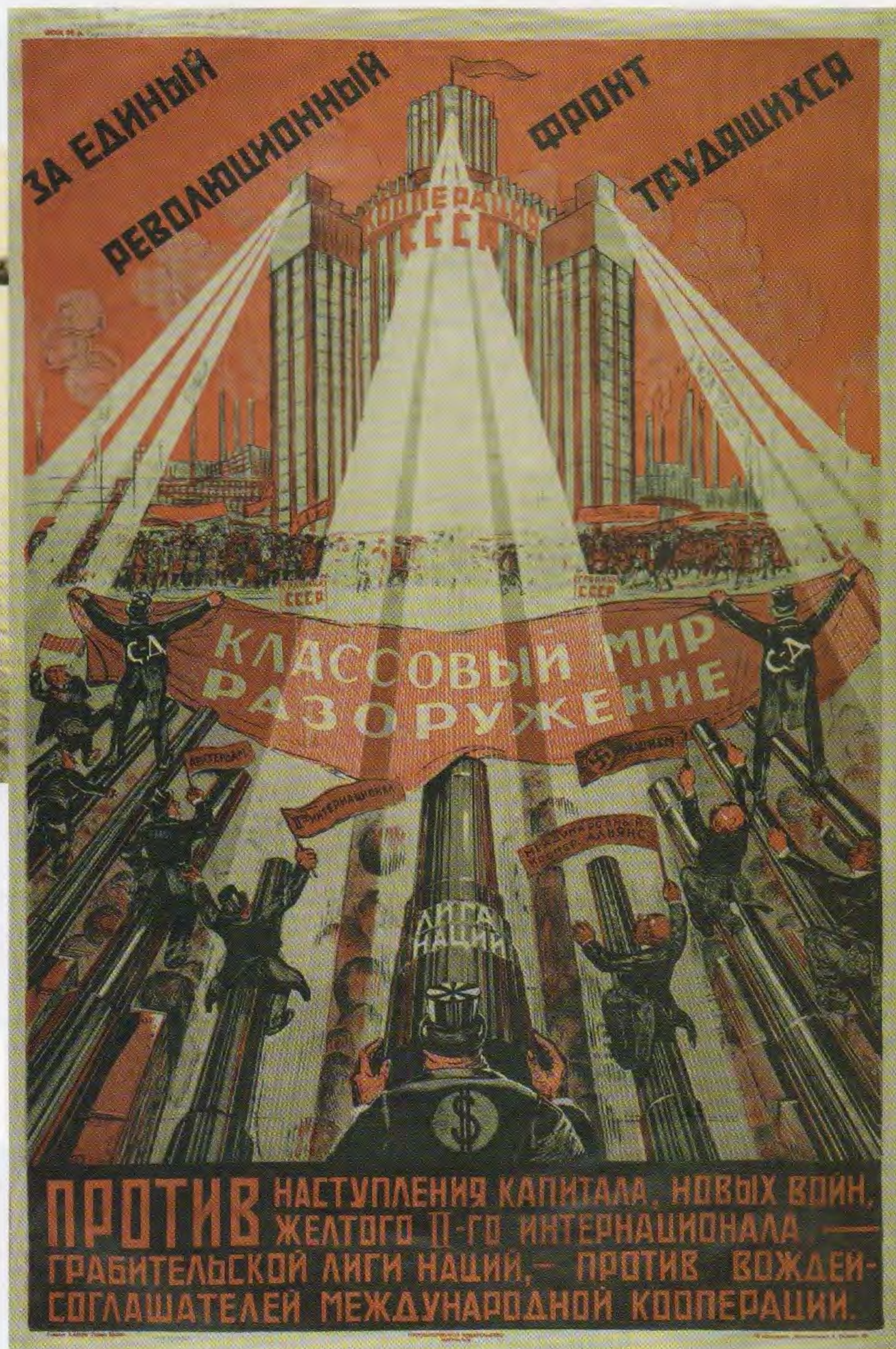
Кооперация СССР. За единый революционный фронт трудящихся. 1919–1930

Один из участников этого рейса вспоминал: ««Красная Звезда» делала свои остановки не только в губернских и уездных городах, но и во всех крупных