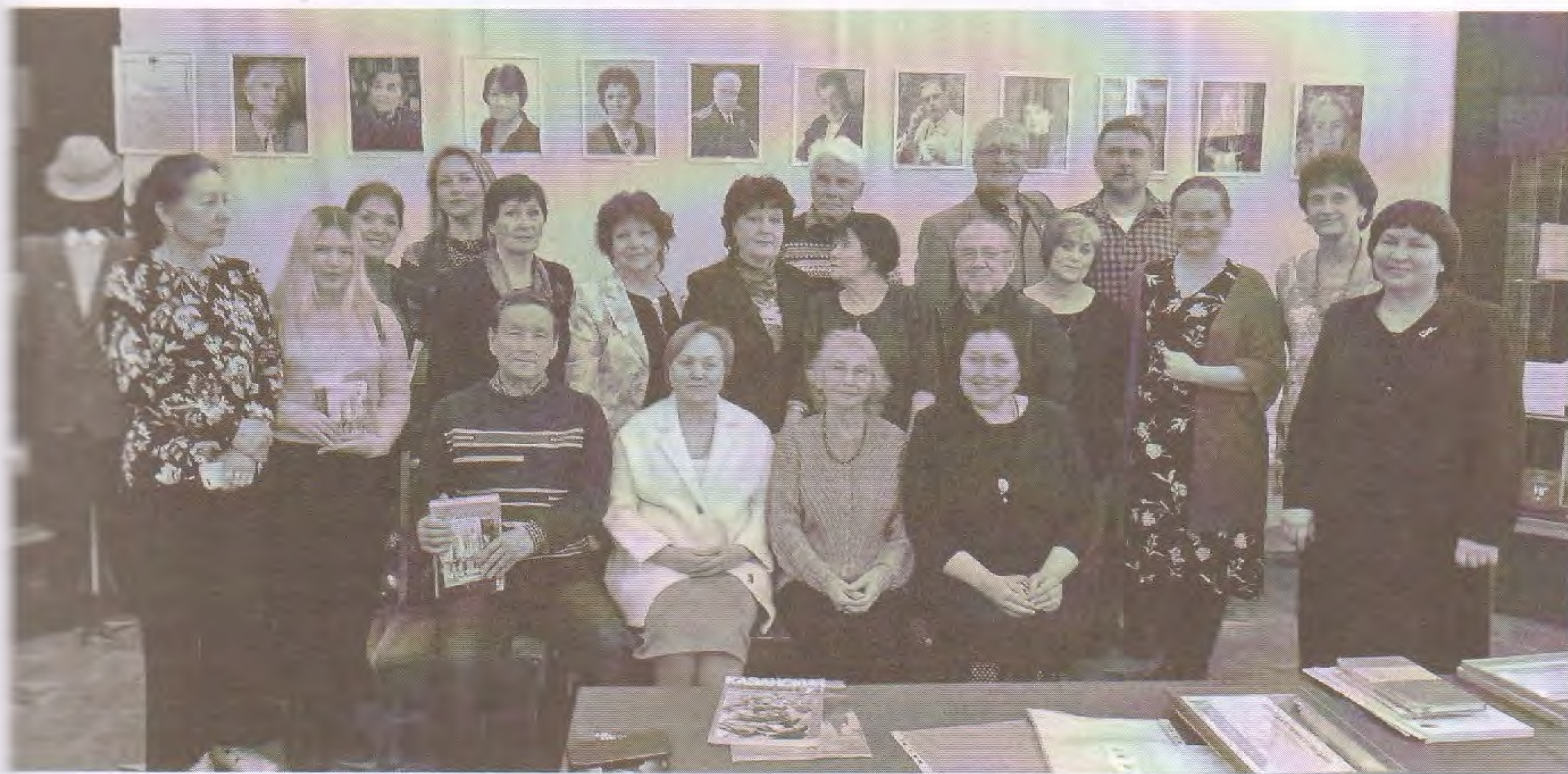
Участники торжественного мероприятия в Димитровградском краеведческом музее

Жители и гости Димитровграда могут принять участие в литературных чтениях, встречах с писателями и в других предстоящих культурных мероприятиях, посвященных 70-летию литературного объединения «Черемшан».