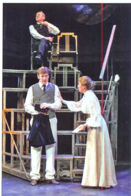
Санкт-петербургский театр «Русская антреприза им. А. Миронова».