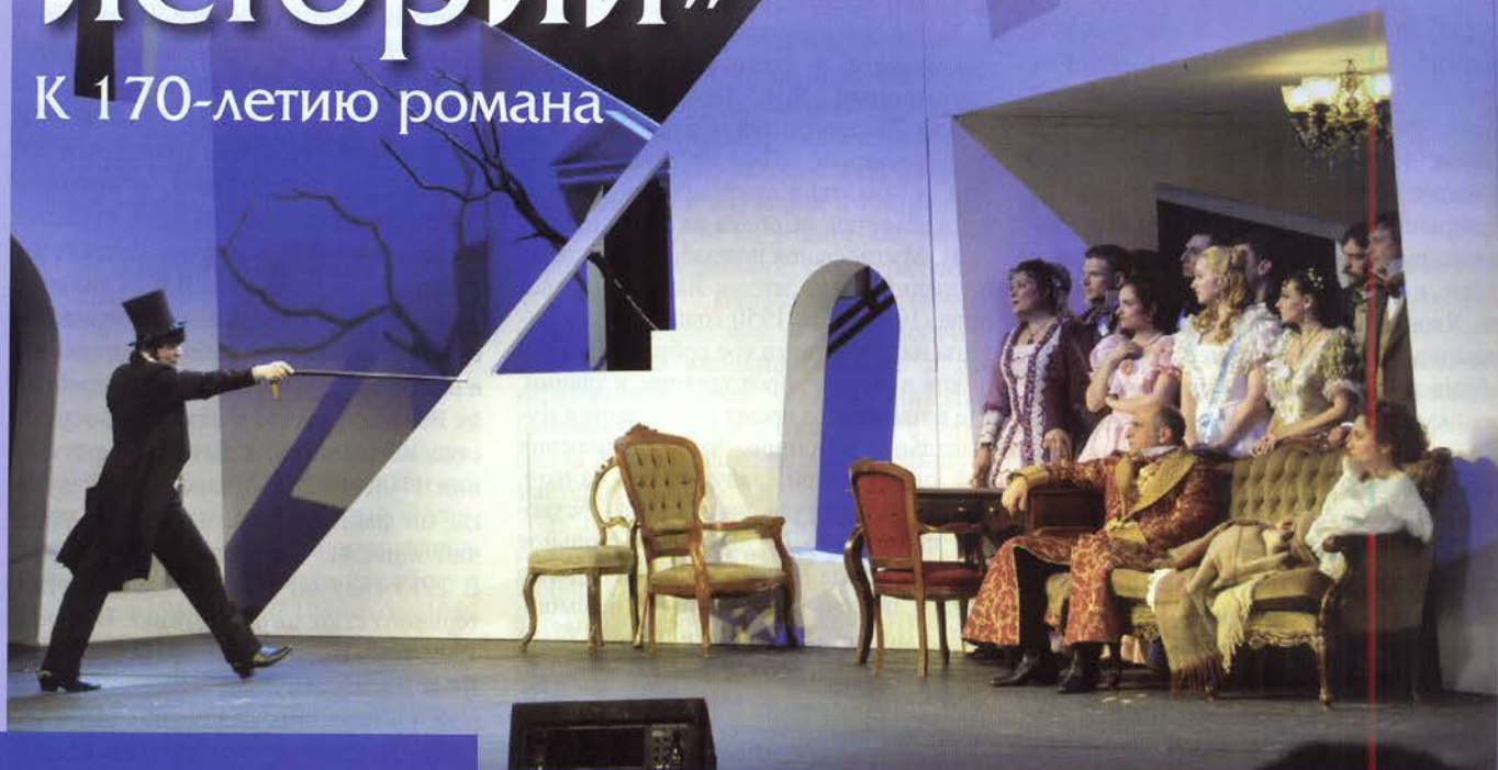
Саратовский ТЮЗ им. Ю.П. Киселёва. Сцена из спектакля

170 лет назад, в марте-апреле 1847 года, в журнале «Современник» вышел в свет первый роман И.А. Гончарова «Обыкновенная история». Эта публикация принесла автору известность, сразу поставив его в ряд первых русских литераторов. Общее впечатление критики и публики высказал В.Г. Белинский: «Повесть Гончарова произвела в Питере фурор – успех неслыханный! Все мнения слились в её пользу. <...> Действительно, талант замечательный».