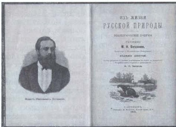
Фрагмент очерка «В лесной глуши». Страницы 6-го издания сборника М.Н. Богданова «Из жизни русской природы». 1902 г. Из библиотеки музея

«Мирскими захребетниками» Богданов называл всех живых существ, обитающих по соседству с человеком и его жильём и прямо или косвенно связанных с его бытом. При этом, по замечанию исследователей