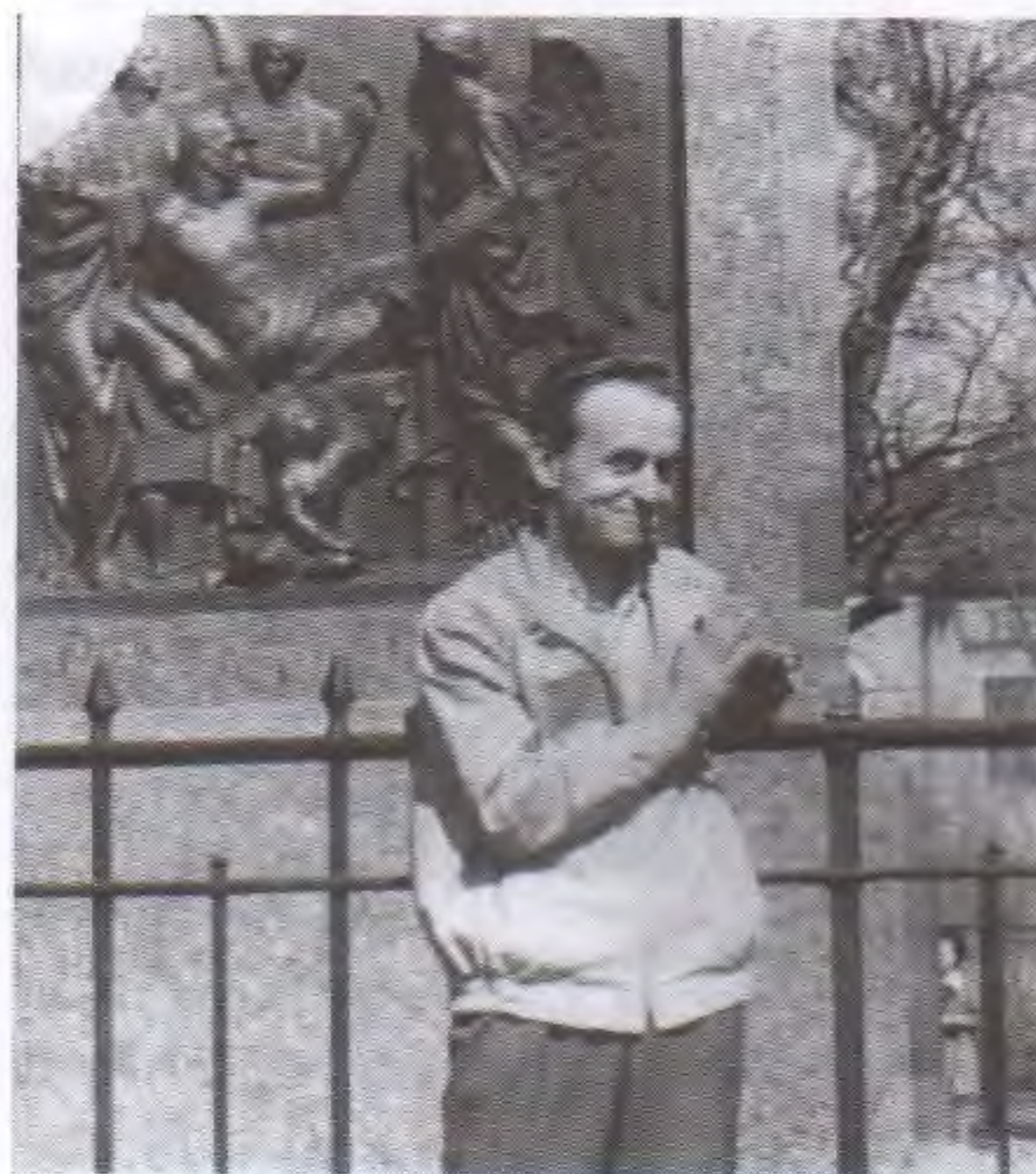
У памятника Н.М. Карамзину