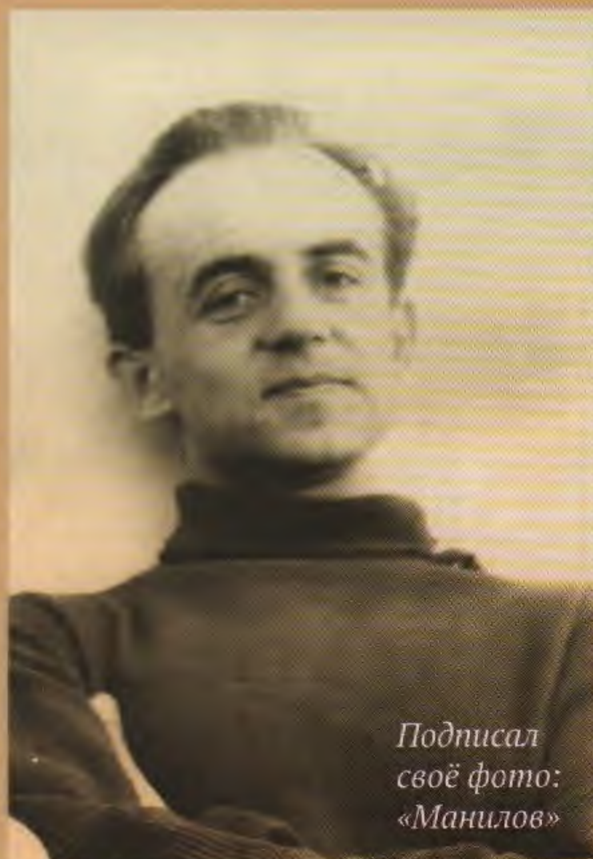
Подписал своё фото: «Манилов»