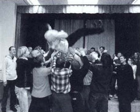
Качать мастера!