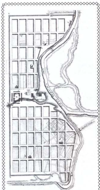
Высочайше утвержденный регулярный план Карсуна 1804 года

XIX века оставался лес, которым тогда изобилывал Карсунский уезд. Сенатор П.И. Сумароков, проезжая в 1838 году через «хороший городок» Карсун, записал в путевой дневник, что «в нем каменного строения только одна церковь и два, три дома, с лавками, по обе стороны». Всего же домов в ту пору насчитывалось 584 (при числе жителей 3709 человек). Более полно характер застройки города раскрывают делопроизводственные документы, появившиеся после пожаров 1845 и 1847 годов. Статистическая обработка описей сгоревших крестьянских до-