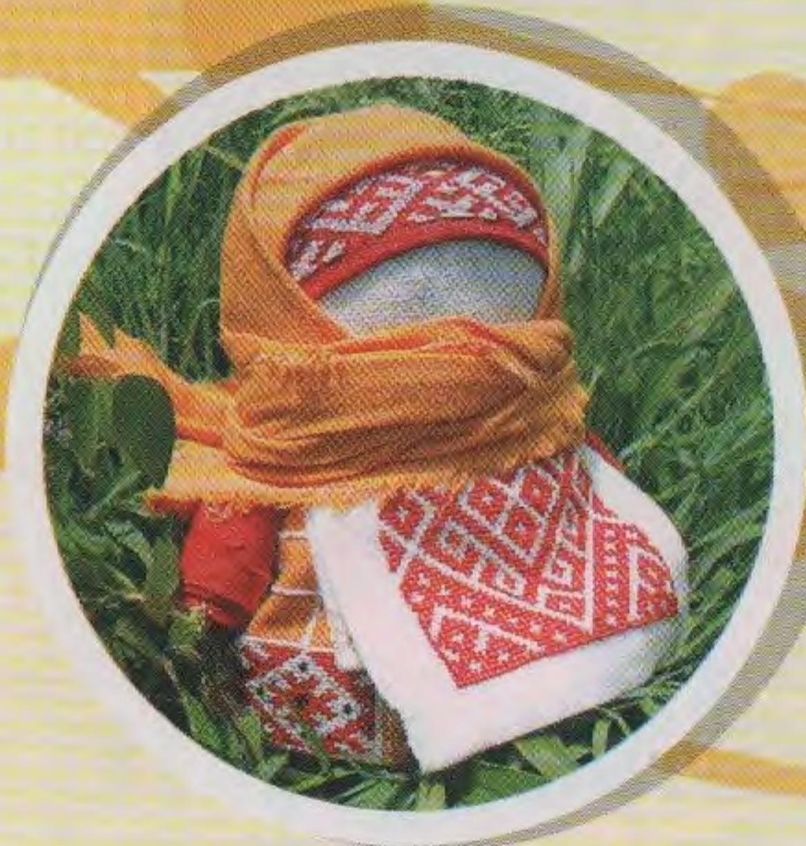
Крупеничка или Зерновушка

Таких кукол дети начинали «вертеть» с пяти лет. Бабушка даже показала, как её делали. Свертывали в «скалку» любой кусочек ткани, белой тряпицей обтягивали лицо, перетягивали льняной ниткой – и простая кукла готова.