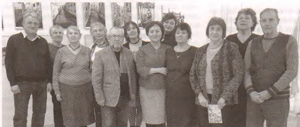
Писатели «Слова» в культурно-выставочном центре «Радуга»

«Ну что же, растите, Читайте, ребята. Пусть будут безоблачны Ваши года. Вчера на войне Умирили солдаты, Чтоб вы не узнали Войны никогда».