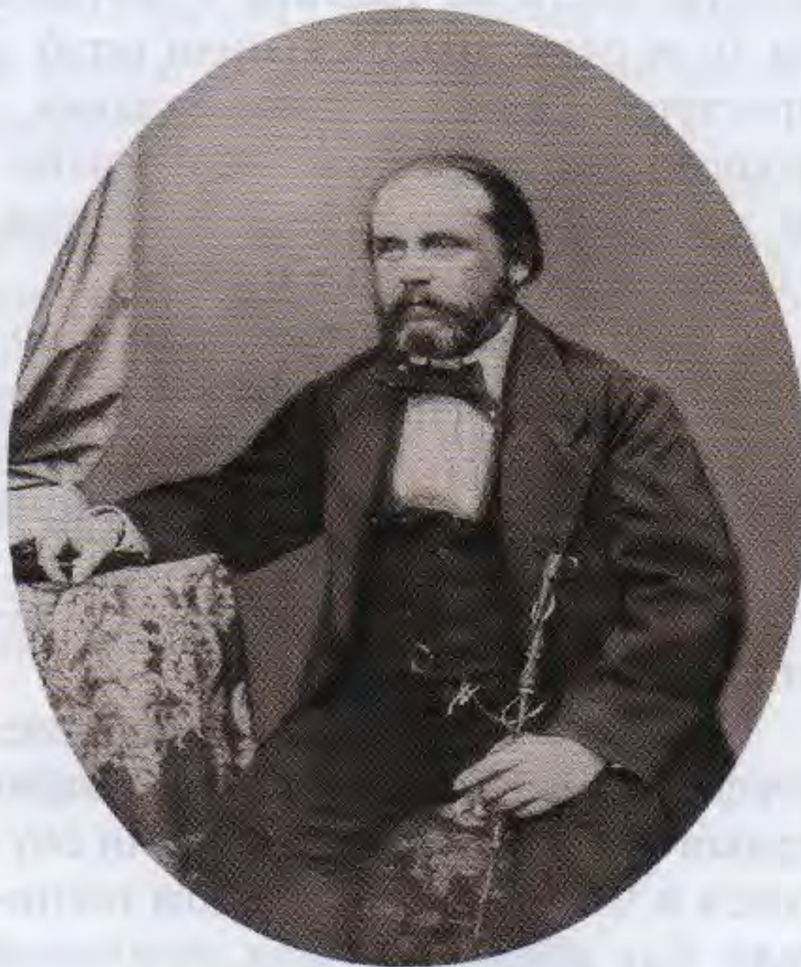
И.А. Гончаров. 1862

ние выставки стало широко употребляться.