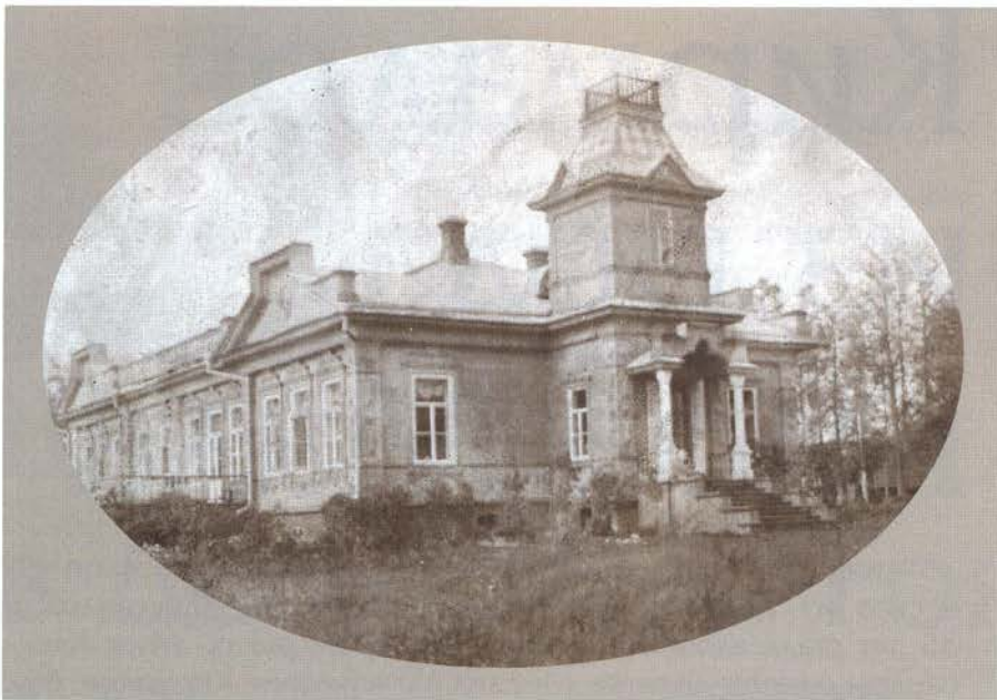
Дом Кирмаловых в с. Хухорево. Фото нач. XIX в. УКМ

целый лист написал! Да как сил стало? Зачем ты денег-то прислал? Ведь я же тебе подарил обе статуэтки. Особенно себя я не продаю: я только покупаю его, то есть себя... Фу-ты, как неловко сказать!».