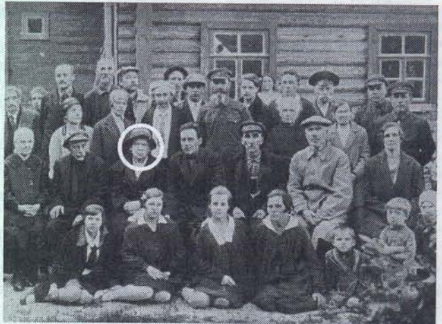
А. И. Ульянова-Елизарова среди сотрудников дома-музея В. И. Ленина, 1931 г.