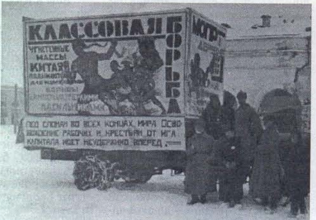
Агитавтомобиль возле торговых рядов. 1920-е гг.