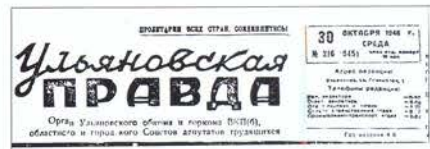
Первый логотип газеты «Ульяновская правда»