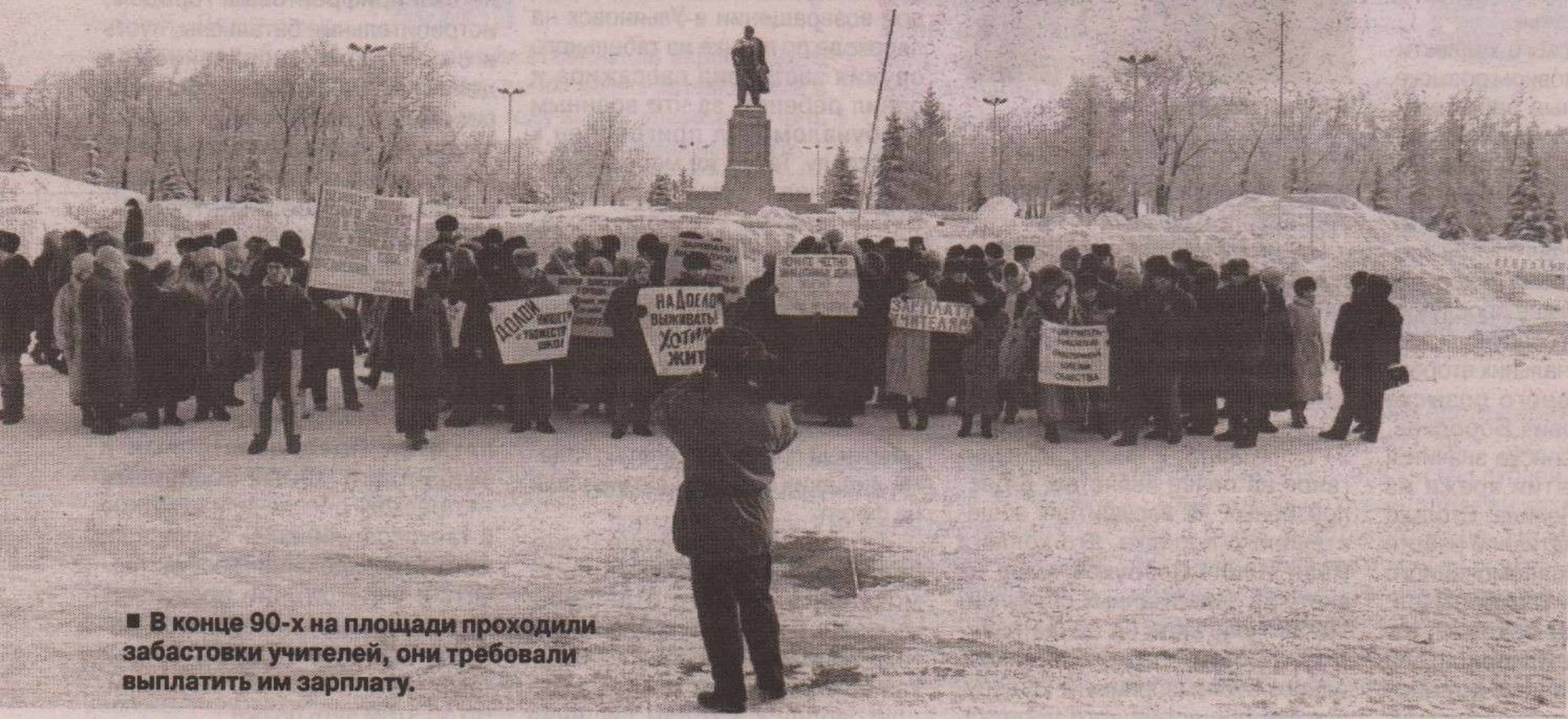
■ В конце 90-х на площади проходили забастовки учителей, они требовали выплатить им зарплату.

3. Основание памятника Ленину на площади однажды полили... водкой. И это были не хулиганы, а китайские туристы, таким образом они выразили почтение вождю.