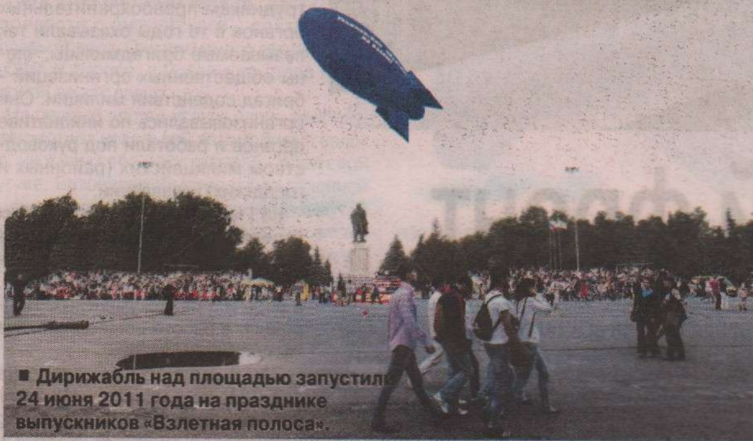
■ Дирижабль над площадью запустили 24 июня 2011 года на празднике выпускников «Взлетная полоса».

- Нам неплохо бы ввести «табу на переименования», поскольку это только ссорит людей. Мне звонили десятки граждан после появления новости, некоторые в предынфарктном состоянии. Чего добиваются переименованием?