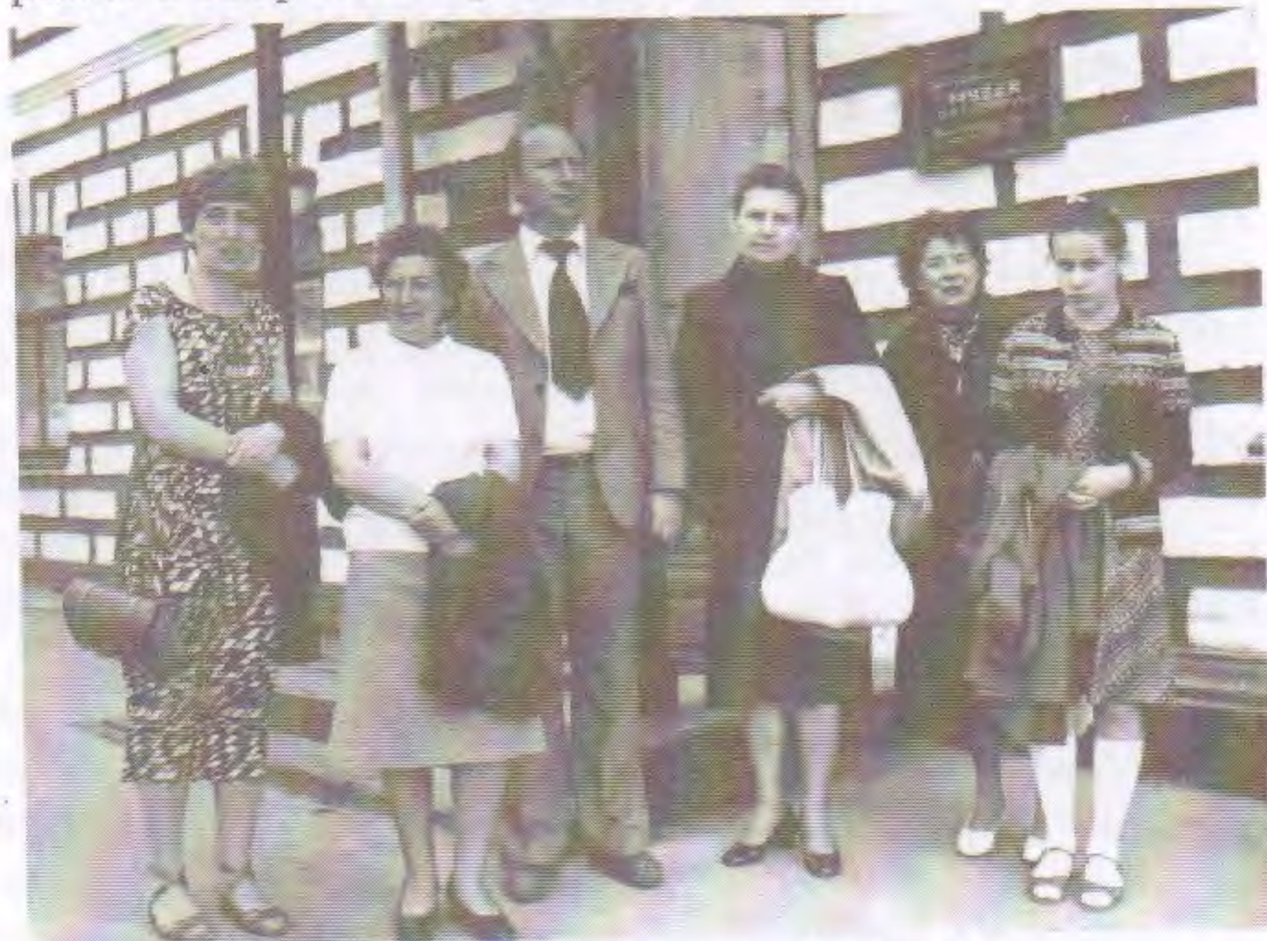
Открытие Историко-литературного музея И.А. Гончарова. Ульяновск, 1982 г.