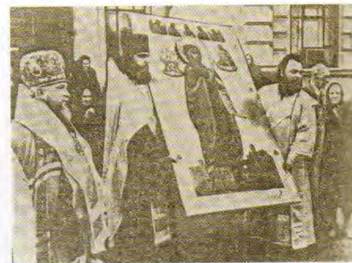
Вынос иконы из краеведческого музея. 1991 год.

её участникам по окончании семинара... И лишь позже я узнал, что никто из учителей газету так и не получил, партийные чиновники не хотели, чтобы правду о грабеже церкви узнали жители района.