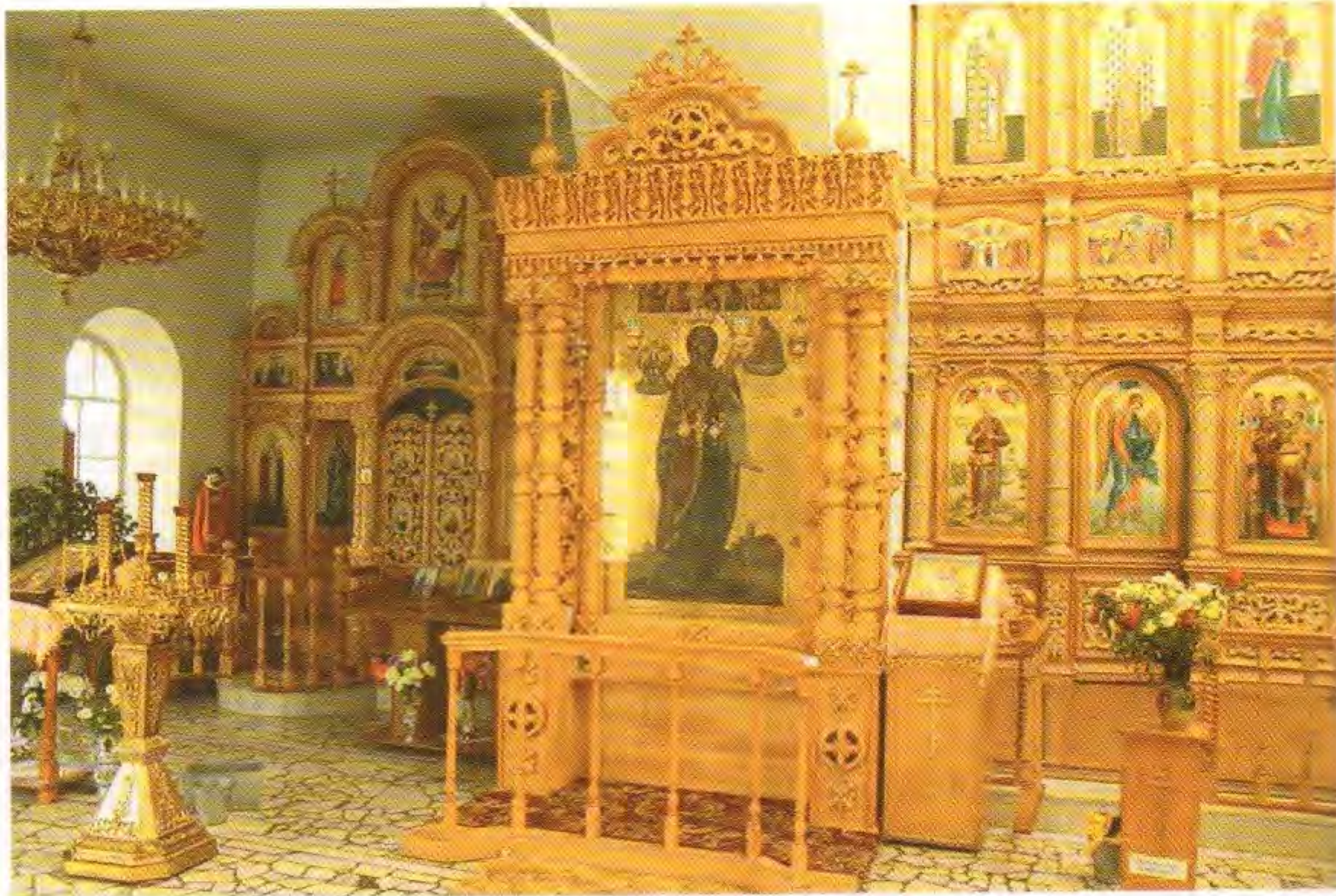
Иконостас Богоявленского храма в Старой Майне