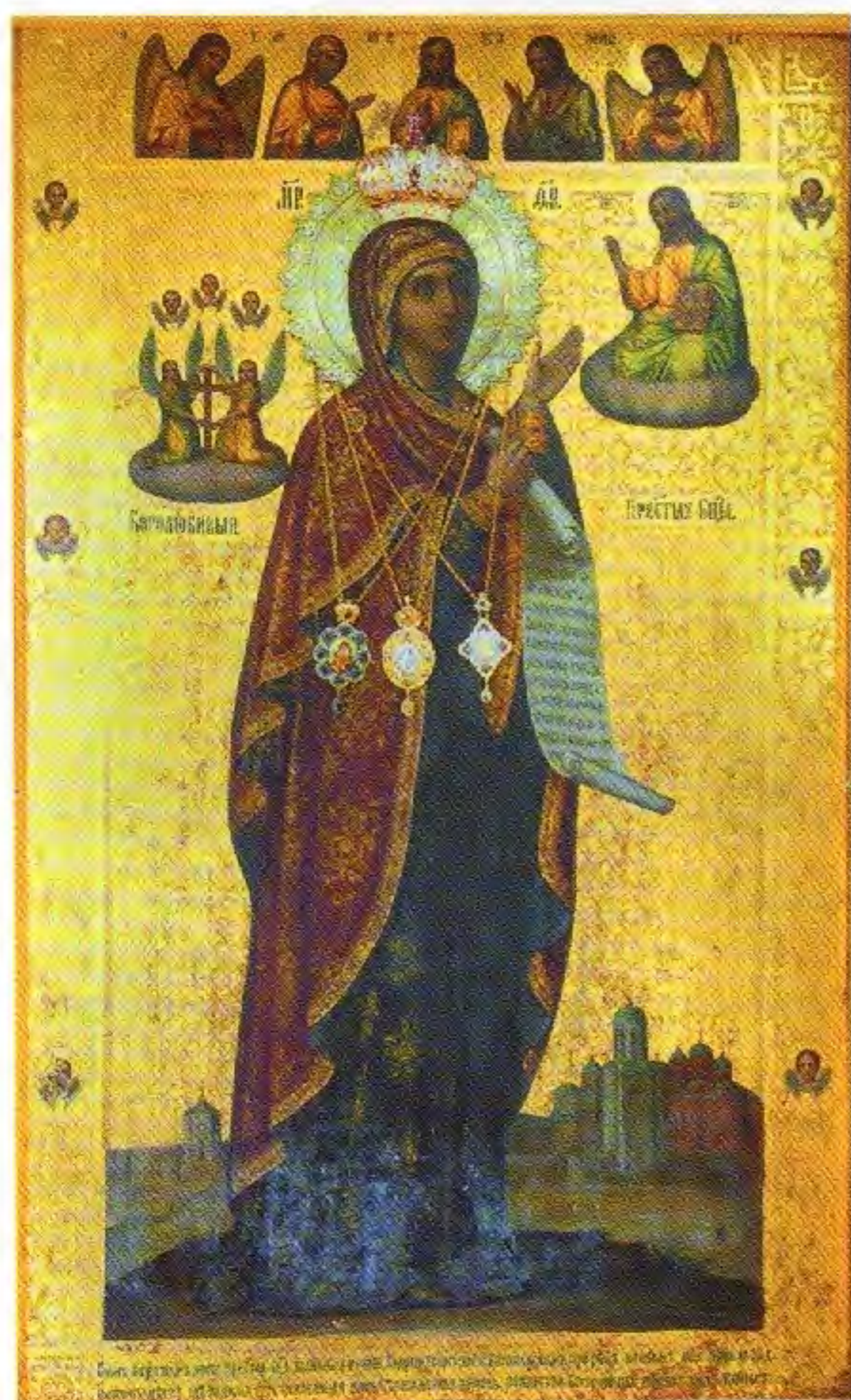
Боголюбивая икона Божией Матери