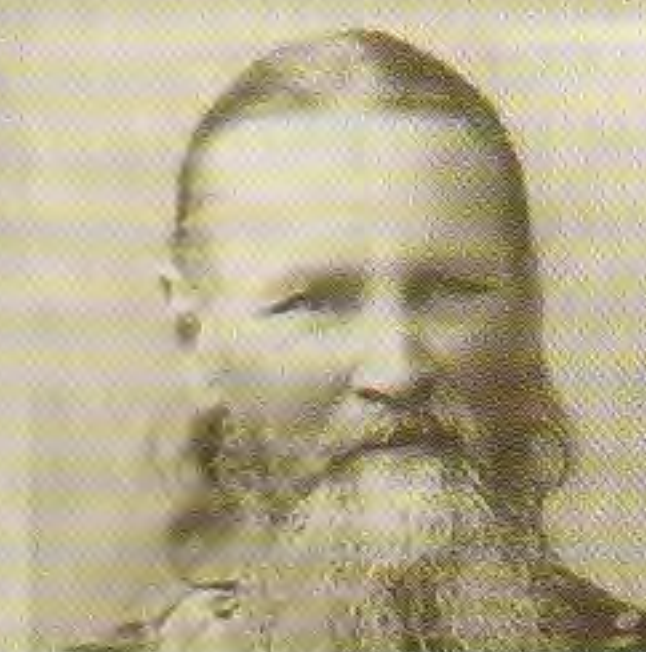
Святой праведный Иоанн Кронштадтский (Сергеев)