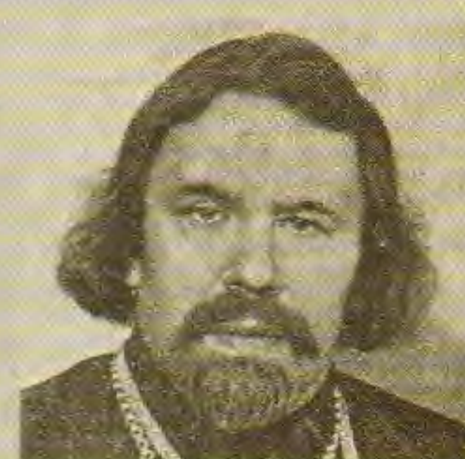
Протоиерей Александр Смирнов