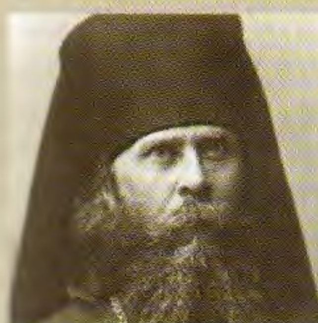
Священномученик Александр (Трапицын)