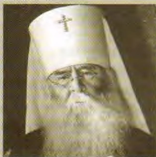
Патриарх Сергей (Страгородский)