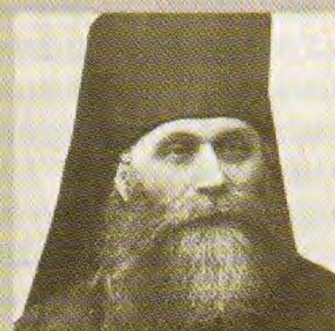
Епископ Никандр (Молчанов)