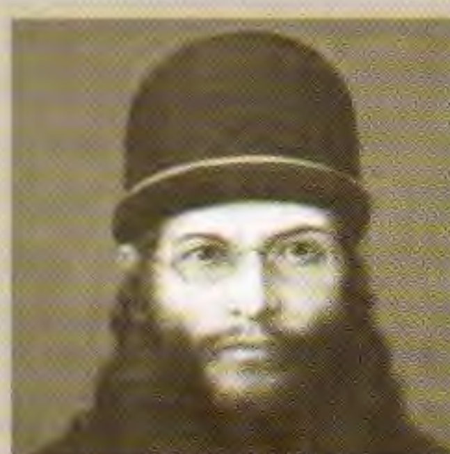
Епископ Александр (Светлаков)