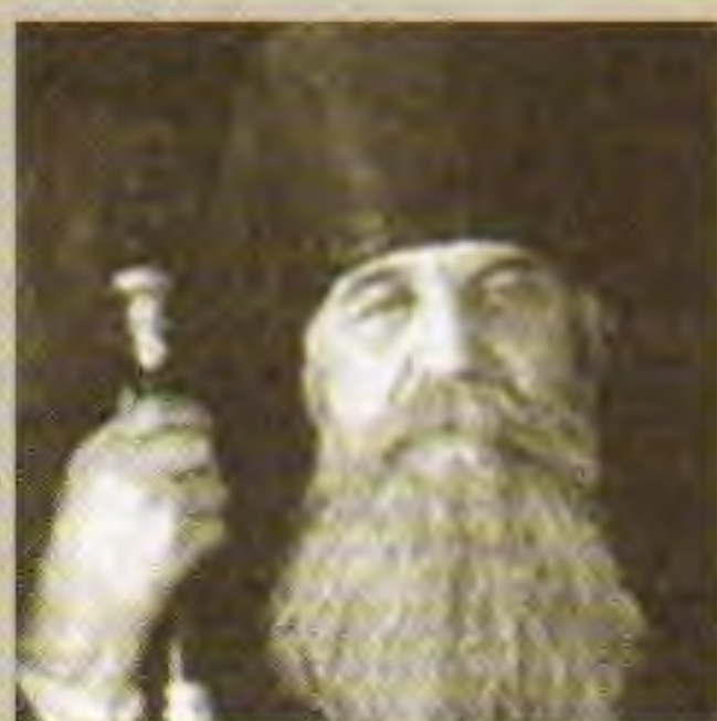
Епископ Серафим (Шарапов)