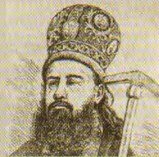
Архимандрит Гавриил (Воскресенский)