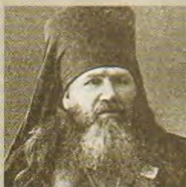
Епископ Михаил (Семёнов)