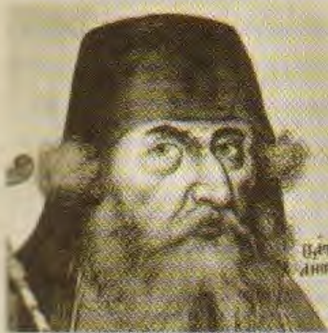
Макарий III, патриарх Антиохийский