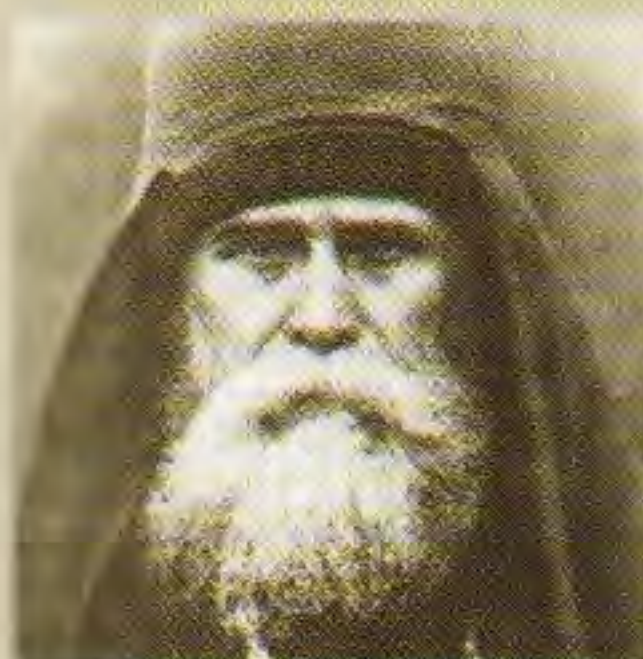
Архимандрит Павел Прусский (Леднёв)