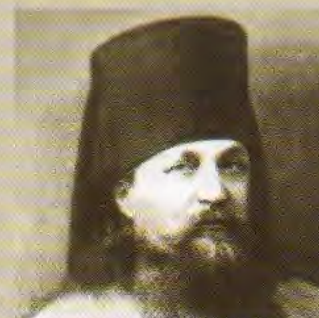
Епископ Антоний (Флоренсов)