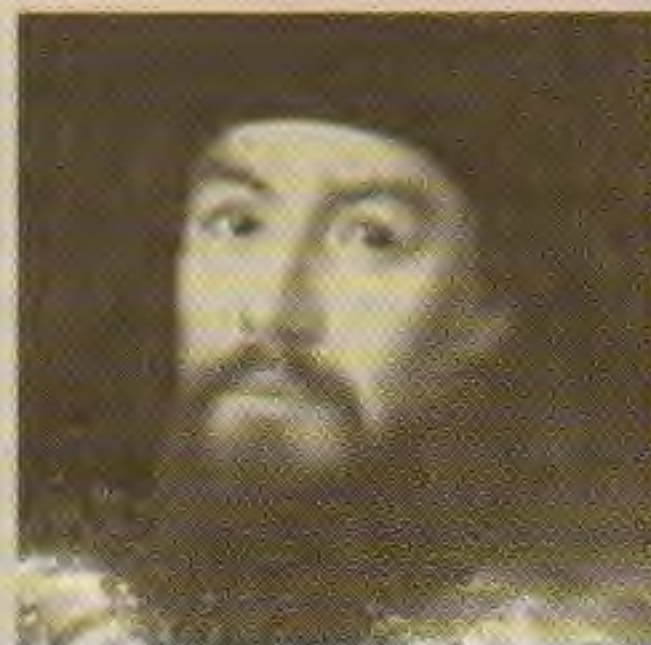
Епископ Гавриил (Петров)