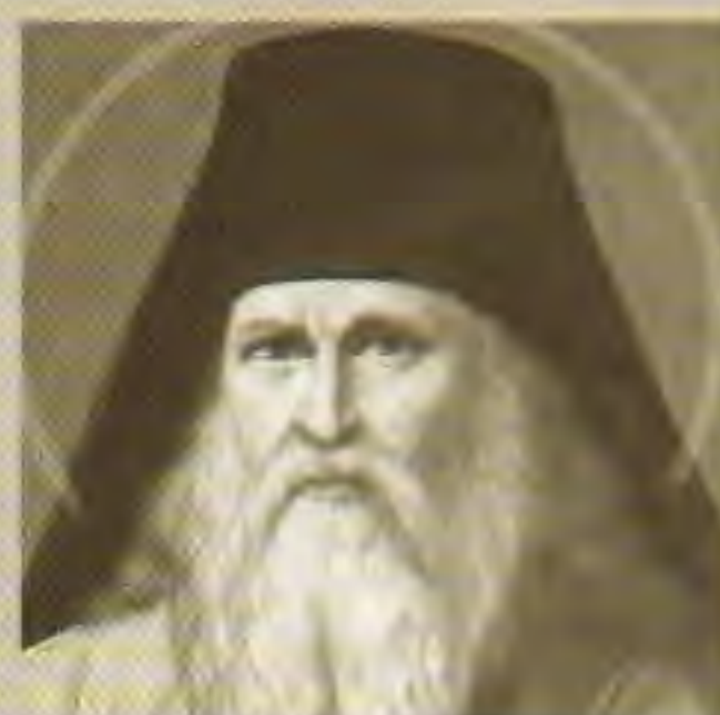
Епископ Герасим (Добросердов)