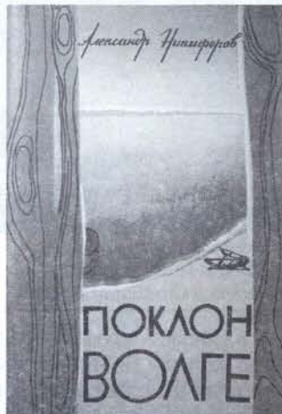
Обложка книги «Поклон Волге», 1987 год