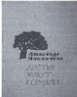
Обложка книги «Листья живут корнями», 1964 год