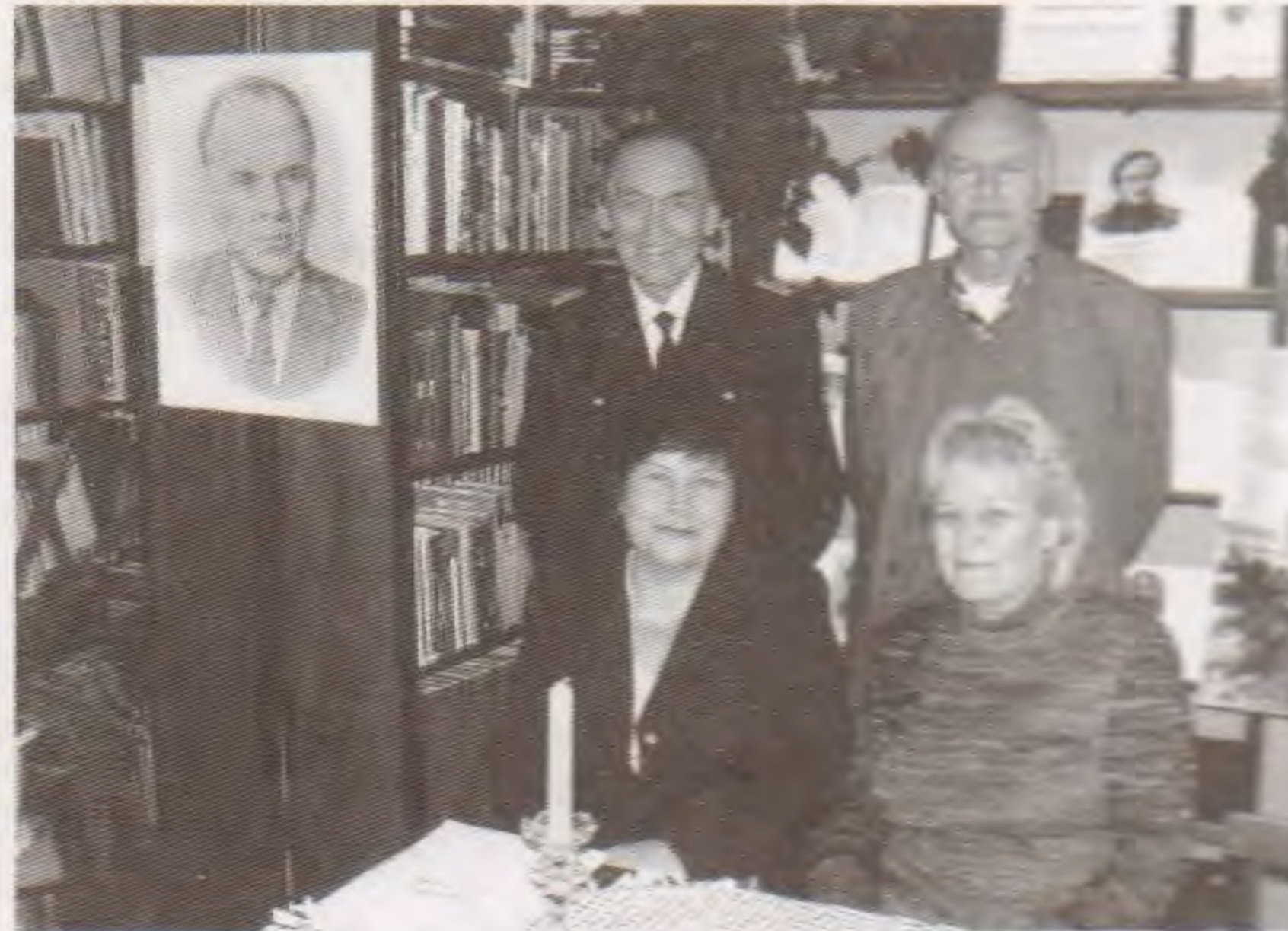
Праздник присвоения библиотеке в Базарном Сызгане имени Паустовского, 2 ноября 2005 г.