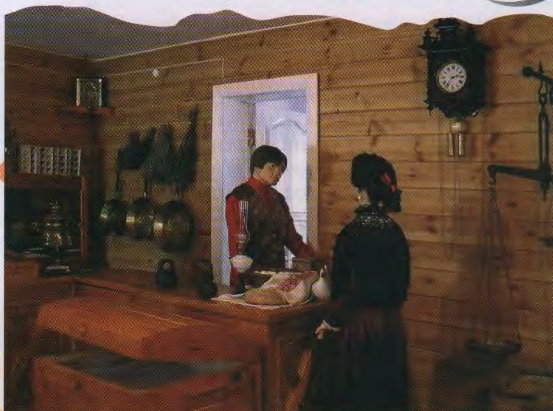
В магазин пришла покупательница.