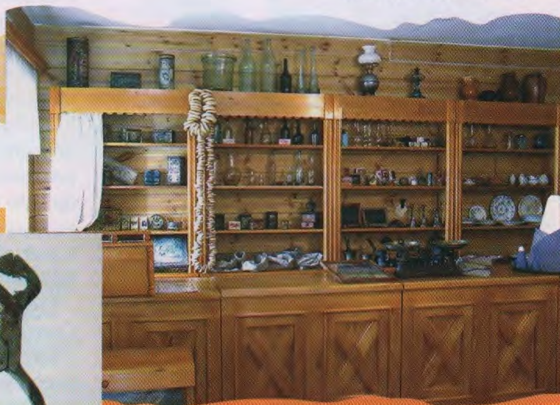
Одна из «витрин» лавки.

Трудно перечислить весь ассортимент этого воссозданного магазинчика. Ведь он насчитывает более ста наименований! Лучше прийти и увидеть всё своими глазами. А вещи, которые хранятся в музее, поведают тебе такие истории, которые ты никогда не забудешь!