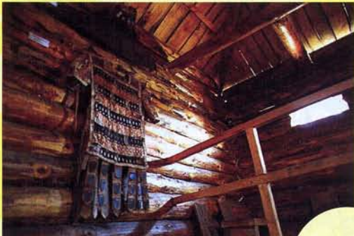
Боевые доспехи кочевника на Засечной.