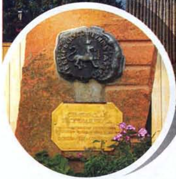
Первый герб Симбирска.