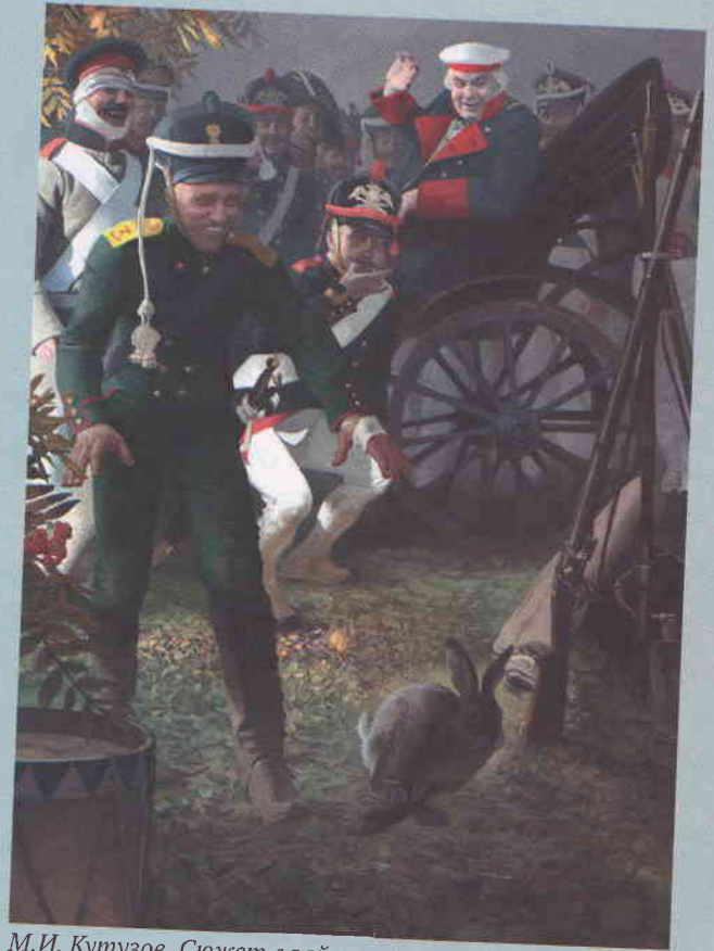
М.И. Кутузов. Сюжет с зайцем