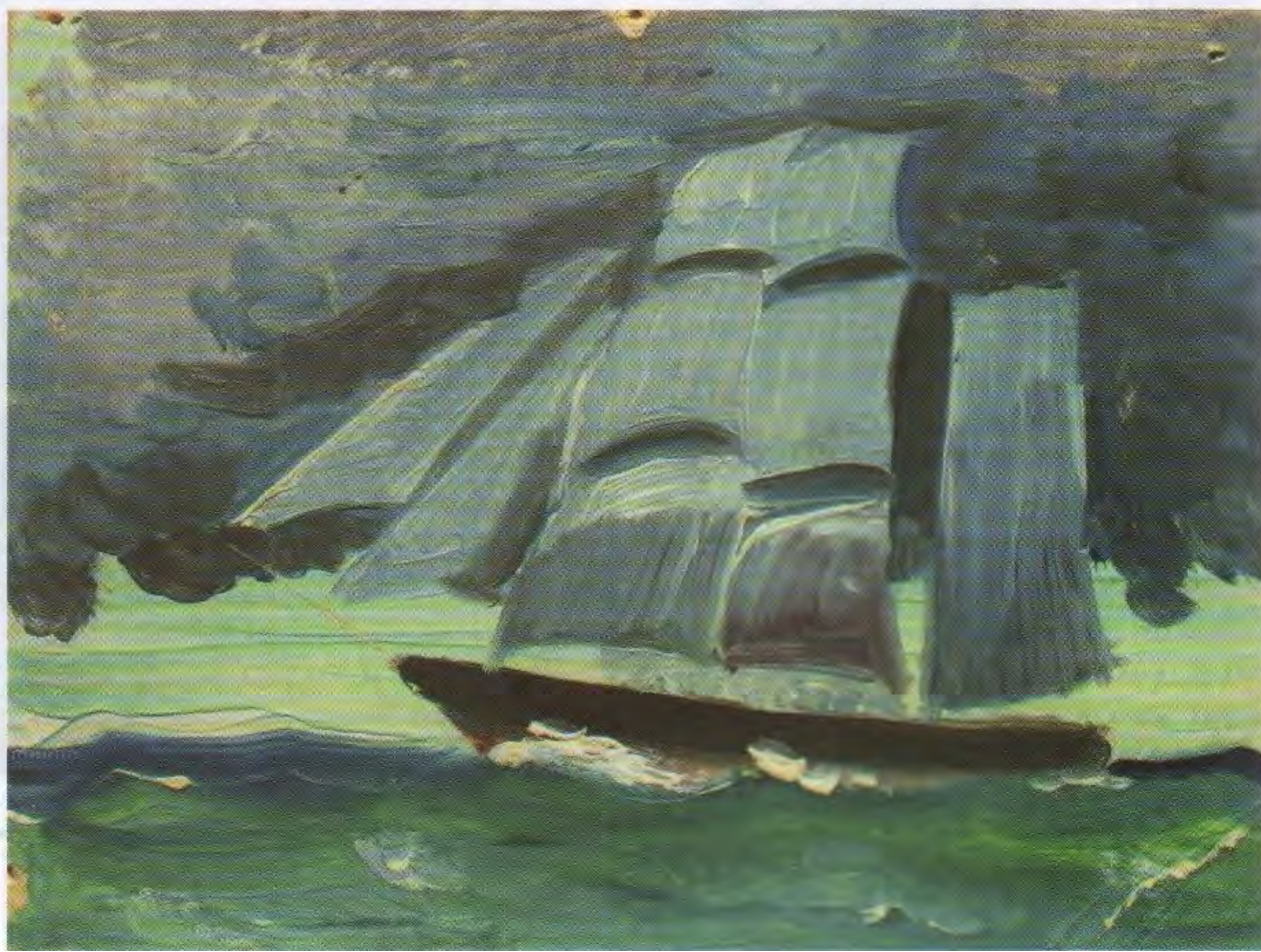
«Бригантина поднимает паруса». К., м. 7×13,2. 1950-е

Жить ему оставалось чуть больше полугода. Юмор Гены, уже знающего страшный диагноз, стал в рисунках ещё мрачнее: на лужайке под музыку из магнитофона элегантный