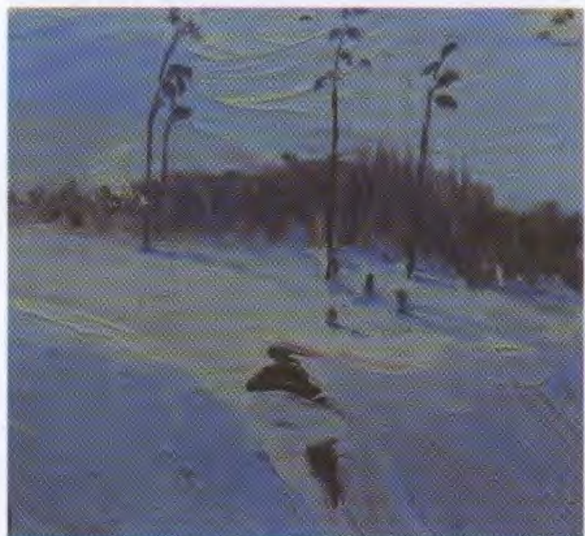
Масло. 9,2×10,5 см. 1950-е

Здесь приведены его почти крошечные этюды маслом со сторонами в 10 или чуть более сантиметров. И каждый – это законченный пейзажный образ. Зимний солнечный день с четырьмя соснами на высоком крутом холме. Задумчивое утреннее поле с перелеском и ветряной мельницей вдали. Автопортрет, где Гена поразительно похож на писателя Юрия Трифонова. А как скупы и точны краски – при том, что автору нет ещё и пятнадцати!