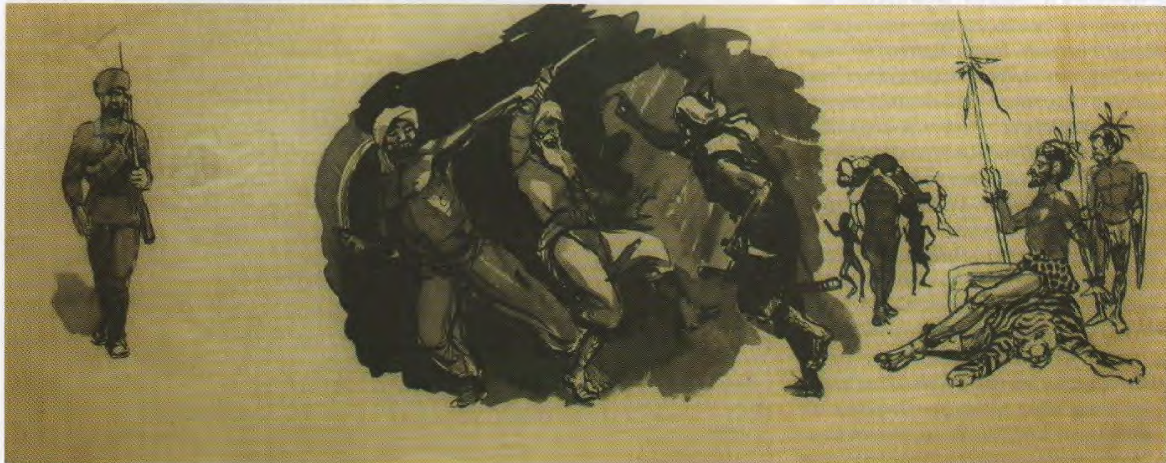
Рисунки-фантазии. Тушь, кисть, перо. 1950-е