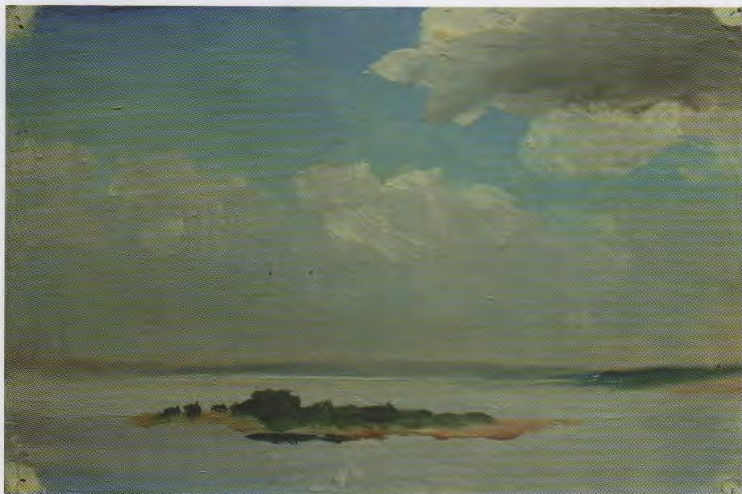
Палицын остров. К., м. 15,5x23,8. 1950-е