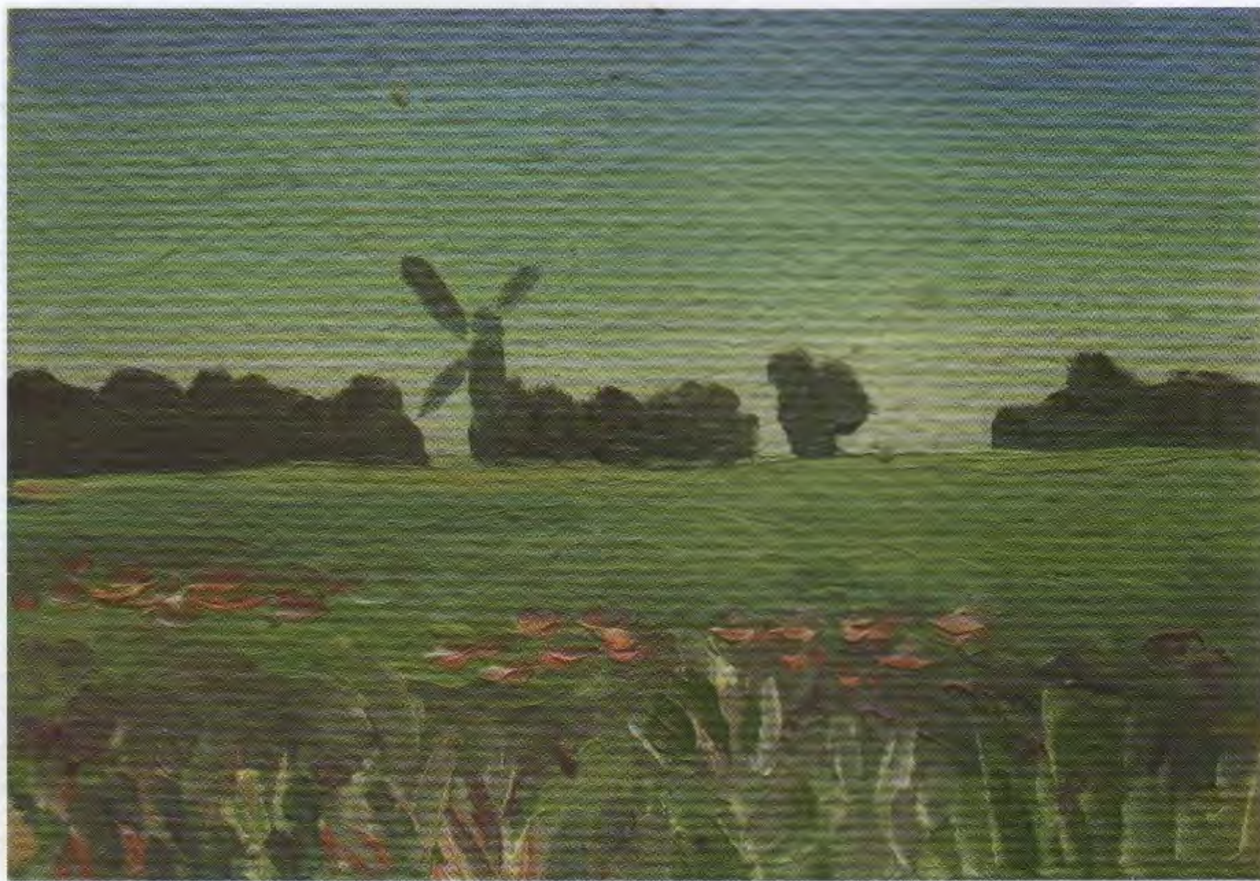
Летний этюд. К., м. 9,6×13,7

Летом 1957 года мы с ним поехали поступать в Московский архитектурный институт. Такая идея нам и в голову бы не пришла, если бы туда