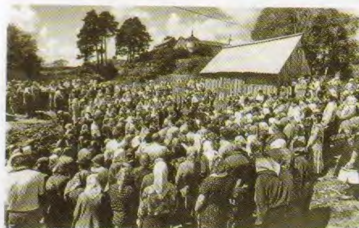
Водосвятский молебен на святом источнике. 21 июля 1997 года

Возвращение чудотворной иконы Казанской Божией Матери в Жадовскую обитель 21 июля 1997 года. Видны полуразрушенные братские корпуса монастыря, фундамент заложенного храма