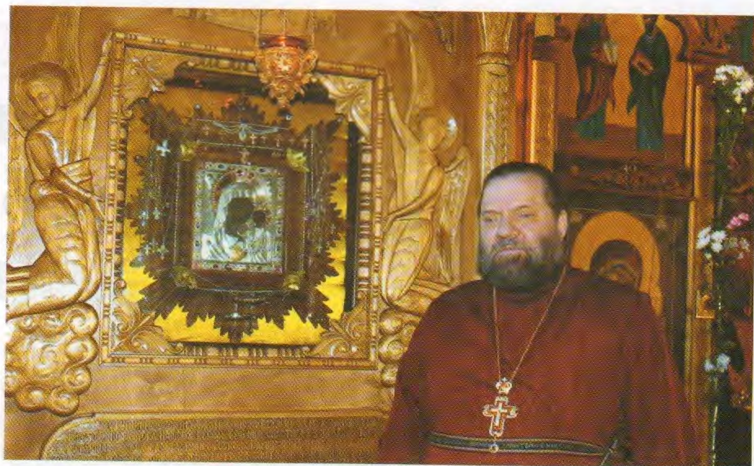
Свято-Никольский храм в селе Оськино Инзенского района