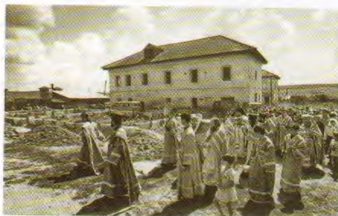
Первая через 70 лет Божественная литургия на территории монастыря. 21 июля 1997 года

Главной святыней нашего края всегда был чудотворный образ Казанской Жадовской Божией Матери. Почти 70 лет она считалась утерянной, но 21 июля 1997 года, в день празднования явления Казанского образа Богородицы, она вернулась в обитель. Духовенство и многочисленные паломники встречали заступницу крестным ходом у святого источника. На монастырском дворе на временном престоле у дощатой стены зернохранилища суконными полотнищами было ограждено место для алтаря, а деревянные стены украшены несколькими иконами. В таких условиях епископ Прокл совершил Святую Евхаристию. Обитель вновь начинала жить! Как же произошло такое чудо?