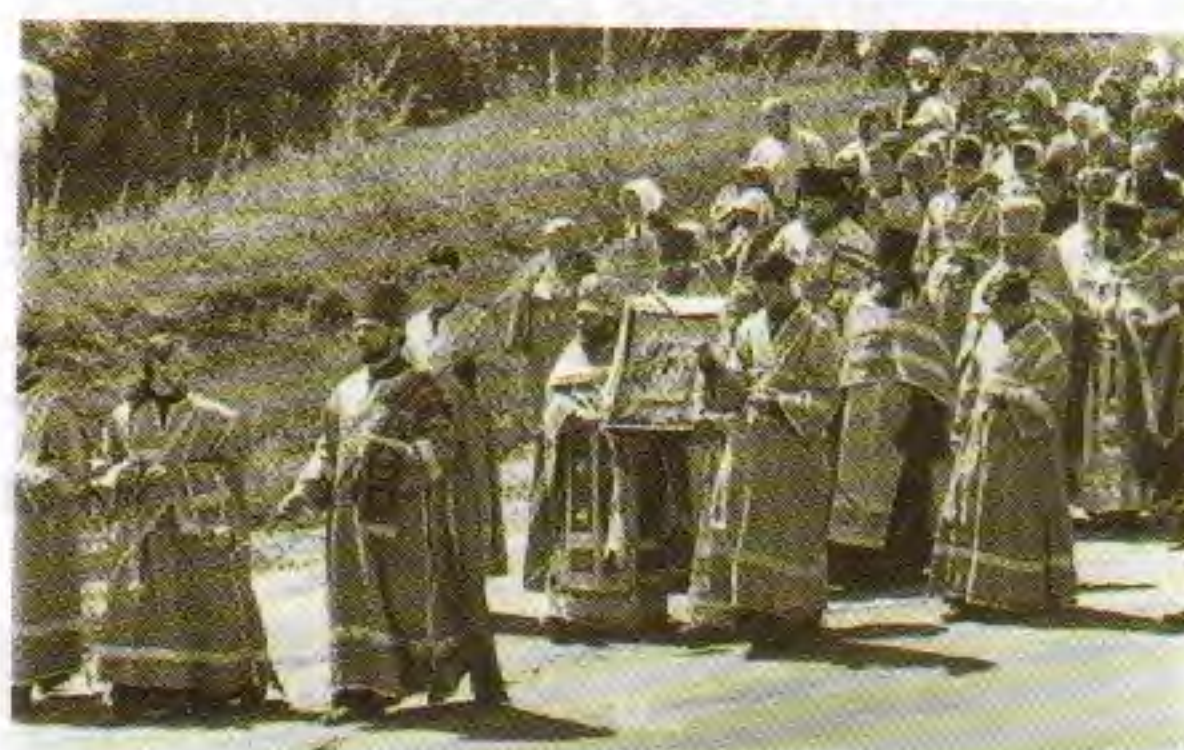
Крестный ход с чудотворной иконой из монастыря к святому источнику. 21 июля 1997 года