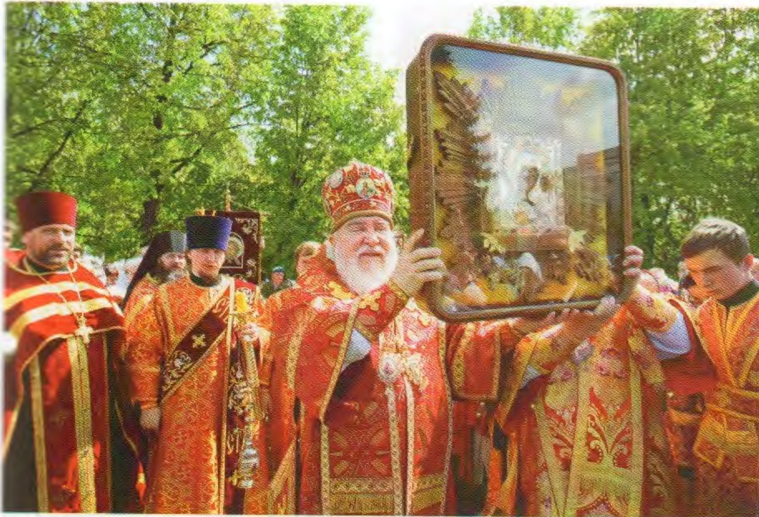
Крестный ход с образом Казанской Божией Матери