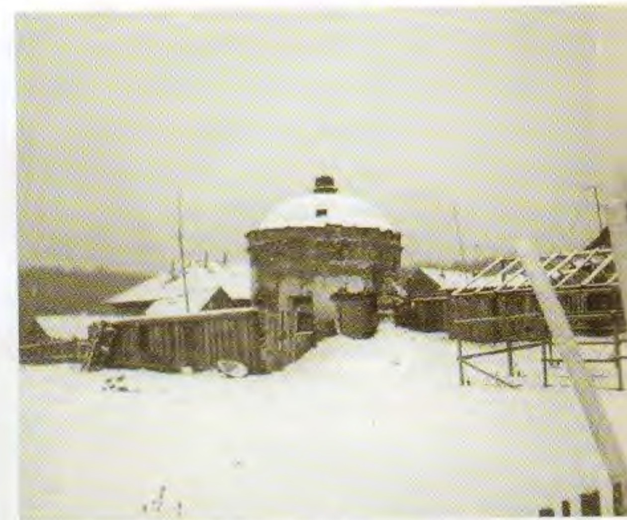
• Северо-западная угловая башня в каменной ограде обители. 1999