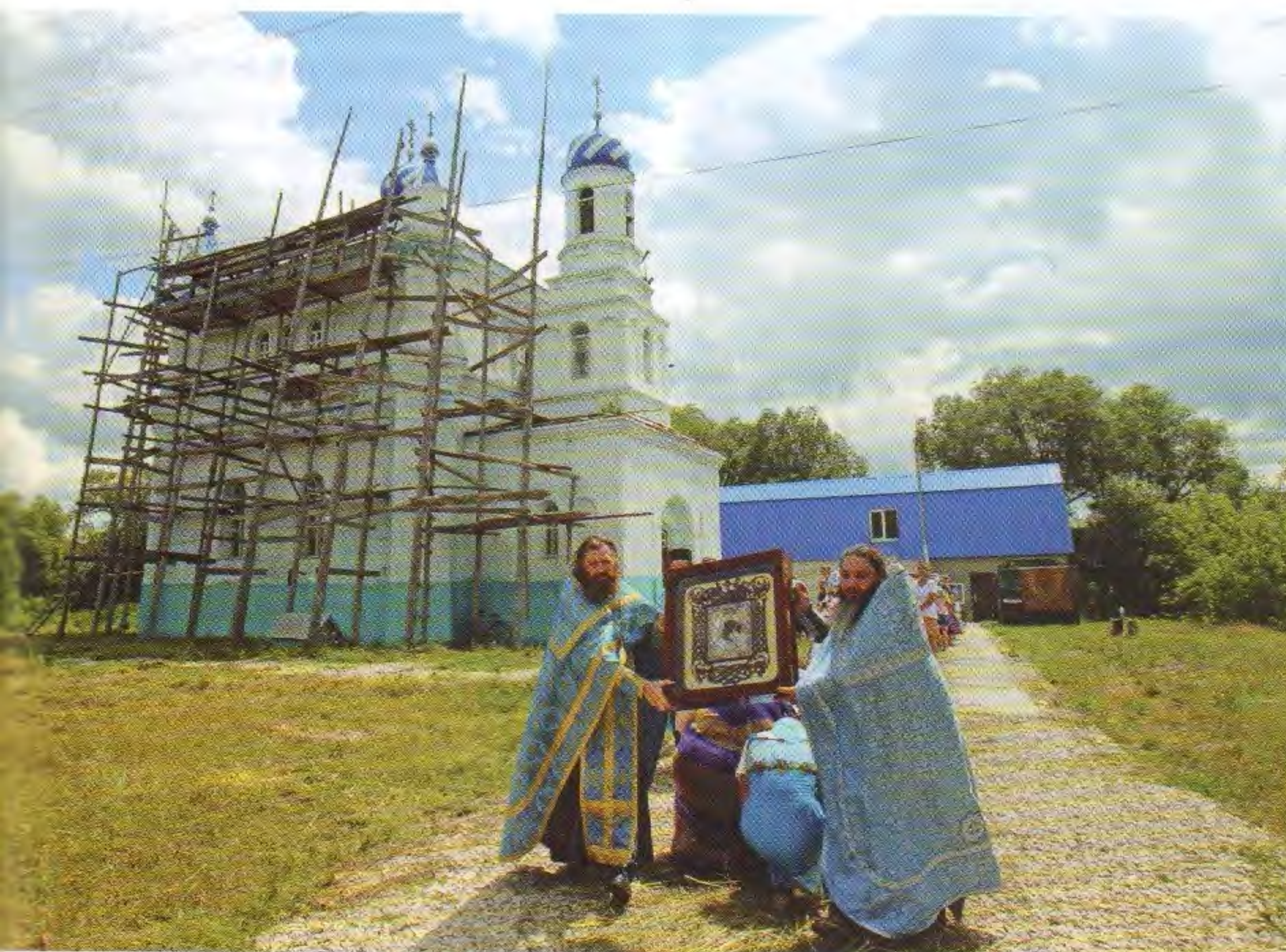
Село Шаховское. Храм Покрова Пресвятой Богородицы