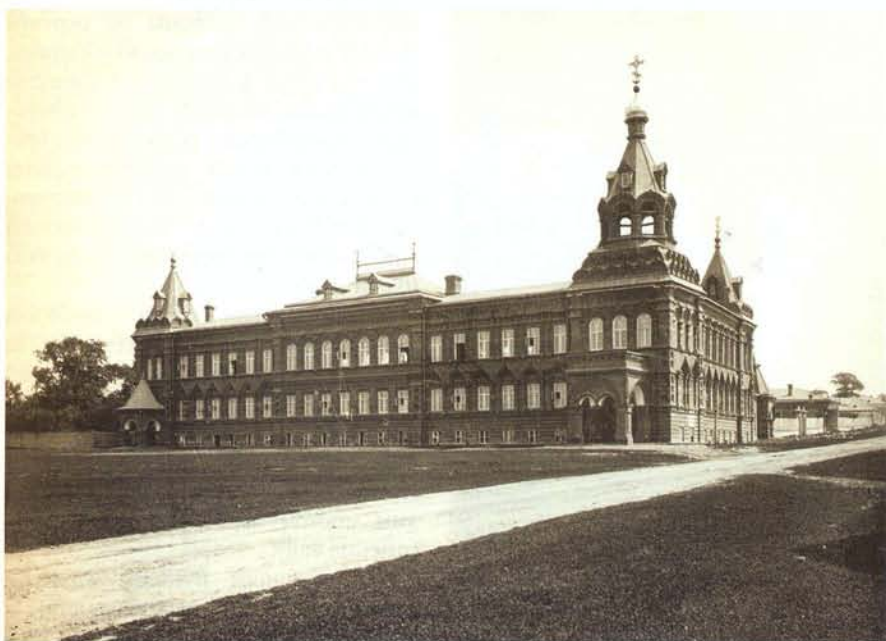
Епархиальный дом

Широкому развитию экскурсионной деятельности в Российской империи способствовало создание в 1863 году Общества любителей естествознания. Его организации работали в обеих столицах, Екатеринбурге, Тифлисе, рядом с Симбирском, в Казани. На экскурсионную активность влияет открытие исторических, культурных и природоведческих памятников, ансамблей, музеев, выставок. Одновременно с этим происходит объединение представителей интеллигенции, которая в первую очередь значится среди зачинателей нового образа жизни, в специ-