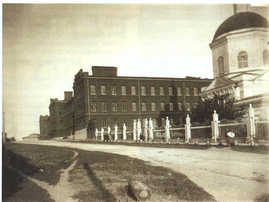
Кадетский корпус (фотография М.П. Дмитриева из фотоальбома «Путеводитель: Волга от истока до Каспия»)

ализированные организации. В 1895 году создается Российское общество туристов (Российский туринг-клуб), в 1901 году – Русское горное общество. Оба общества были ведущими туристскими организациями вплоть до революции.