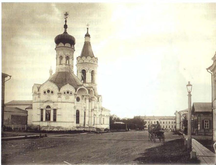
Казанская (Никольская) церковь

Путеводители, как новый жанр, являются проявлением того, что литературовед Сергей Фокин называл «словарным стилем мышления» и в