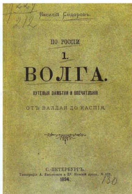
Титульный лист путеводителя Василия Сидорова «Волга. Путевые заметки и впечатления от Валдая до Каспия»