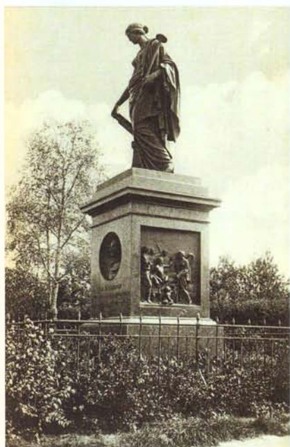
Памятник Н.М. Карамзину. Тот самый барельеф с обнажённым по пояс историографом

св. Николая Чудотворца и Спасского девичьего монастыря. И только дальше описываются светские достопримечательности. Первым, разумеется, идет памятник Карамзину, по поводу которого автор изрядно морализирует: «Памятник, по мысли и исполнению прекрасен, но нельзя не пожалеть, что на обоих барельефах, Карамзин изображен нагим по пояс!». А вот дальше достопримечательности нетипичные: останки древнего вала Симбирской засечной черты за городом и Петропавловский шоссе-спуск к Волге (нынешний спуск Степана Разина).