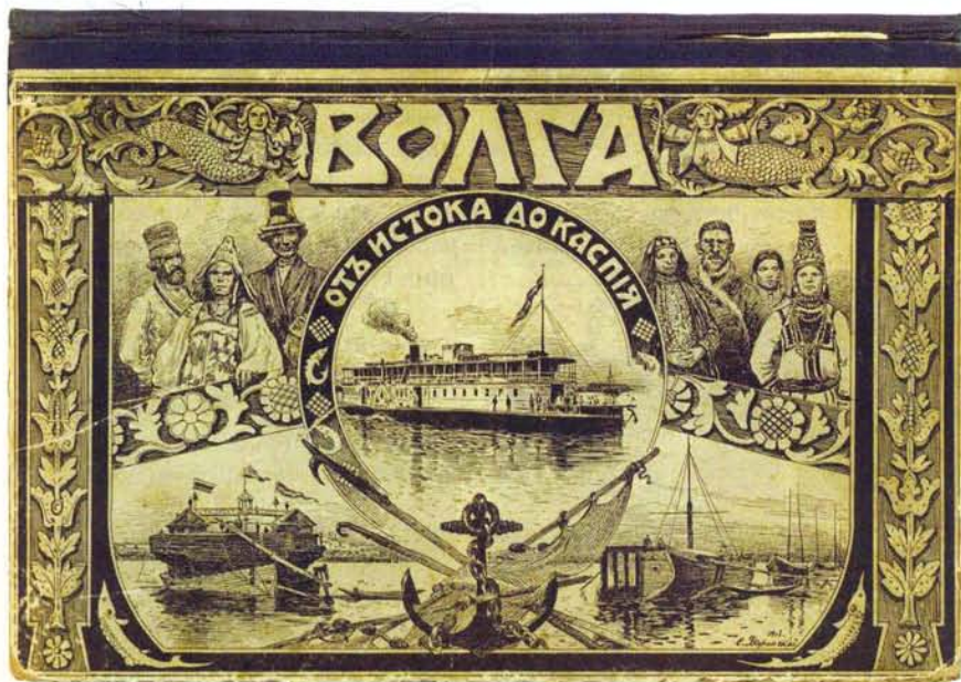
Обложка фотоальбома «Путеводитель: Волга от истока до Каспия»