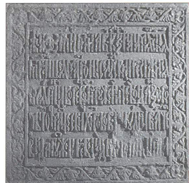
Надпись на могиле Богдана Хитрово в Смоленской церкви Новодевичьего монастыря