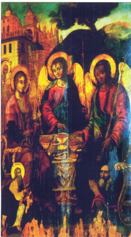
Фрагмент иконы Живоначалной Троицы с предполагаемым изображением Богдана Хитрово (внизу справа)

Инсар соединялась с Атемарской чертой. От Атемара укрепления засечной черты шли до реки Суры. В 1647 году Хитрово продолжил строительство засечной черты за Сурой, где под его руководством возводятся Карсун и другие крепости Карсунской засечной черты. В течение весны и лета 1648 года Б. Хитрово руководит строительством Симбирска и Симбирской засечной черты. В сентябре этого года Хитрово возвращается в столицу, где возглавляет сначала Челобитный приказ (1649–1651), а затем Земский (1651–1655). В 1653 году он ездил с посольством в Польшу, а также принимал активное участие в военных походах против Польши и Швеции, в результате которых были взяты Смоленск, Минск, Вильнюс, Каунас, Гродно, Динабург, Рига и другие (всего 33 города).