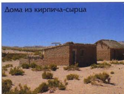
Дома из кирпича-сырца

На обочине стояла старая грузовая машина с побитыми бортами и давно облупившейся краской. Трое индейцев, бросив работу, смотрели, как я,