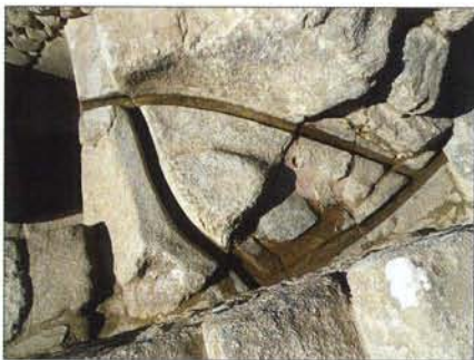
Водопровод в Мачу-Пикчу

поднимался, иначе бы не справился, наверное. Крепкие всё-таки были древние индейцы, не простое это занятие – по горам карабкаться.