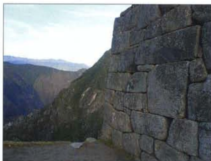
Стены из камней, сложенные индейцами без связующего раствора, стоят веками

Рассвело. В одном месте ветви деревьев расступились, и я увидел Агуас-Калиентес. Увидел глубоко внизу и испугался – надо же столько отмахать! Даже голова чуть закружилась от высоты. Хорошо, что по темноте