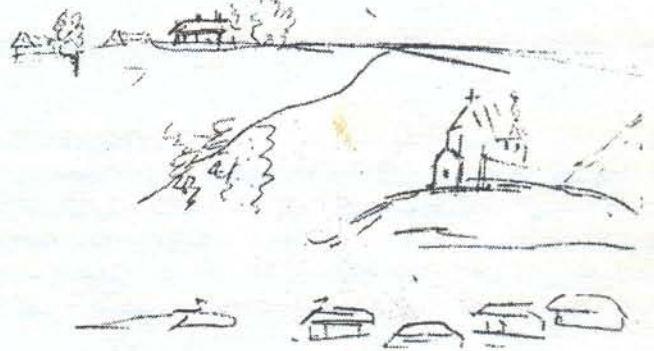
Рисунок А. С. Пушкина с видом на дом В. Карамзина