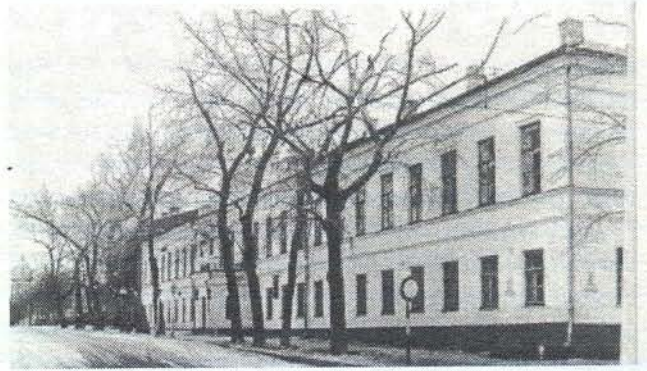
Главное народное училище, постр. в 1790 г. (гимназия № 1).

Оставим Александра Сергеевича за работой над “Историей Пугачева”. Оставим с его мыслями и переживаниями, которые теперь нам более понятны, как понятно, думается, и то, почему так мало он обмолвился о нашем городе.