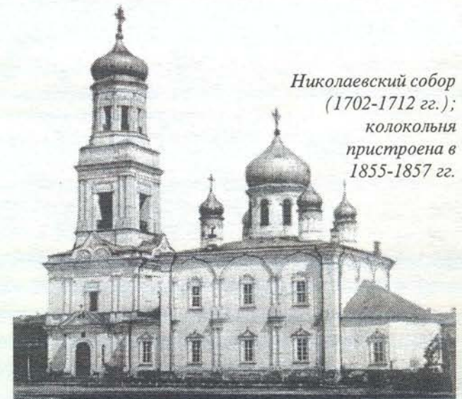
Николаевский собор (1702-1712 гг.); колокольня пристроена в 1855-1857 гг.