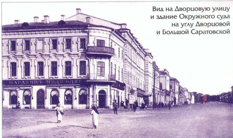
Вид на Дворцовую улицу и здание Окружного суда на углу Дворцовой и Большой Саратовской

Вот как писала об этом столичная газета «Северная Почта»: «Первый пожар вспыхнул в Симбирске 13-го августа, в 3 часа дня, на Дворцовой улице, в задних холодных строениях, так плотно построенных одно к другому, что несколько строений трёх владельцев были охвачены пламенем в одно время. При значительном ветре не было никакой возможности действовать на горящие строения, потому что сплошная постройка и тесные дворы препятствовали действию пожарных инструментов и даже не позволяли въехать на двор... По слухам, ходившим в то время, первый из этих пожаров можно было относить к неосторожности хозяев, будто бы варивших в амбаре или на погребе варенье...».