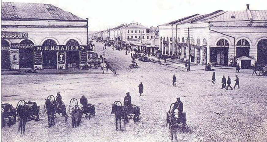
Извозчики и Дворцовая улица от Торговых рядов