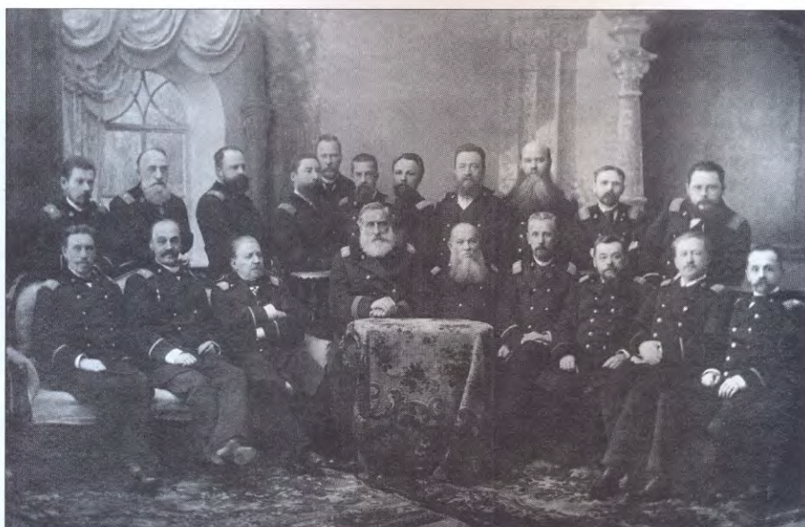
Члены Самарского окружного суда. 1895

На третий день в помещение посадской думы приглашены были гласные