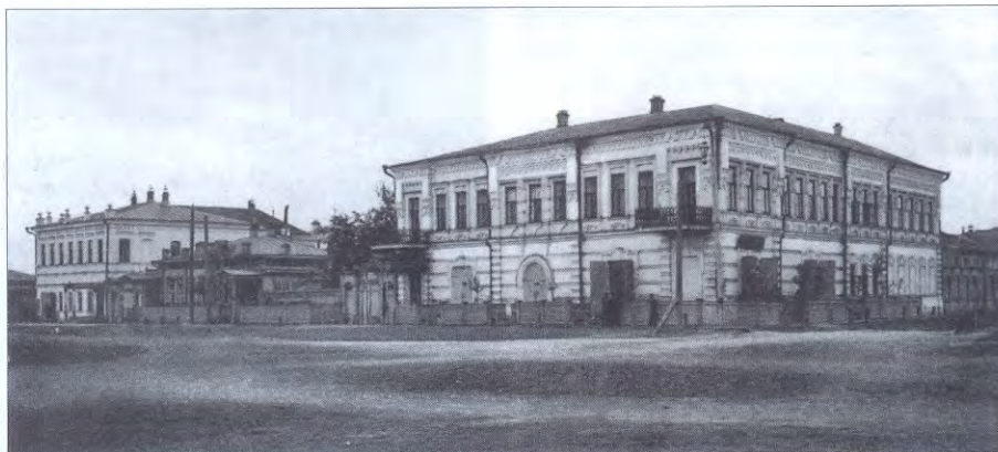
Мелекесс. Дом посадского головы