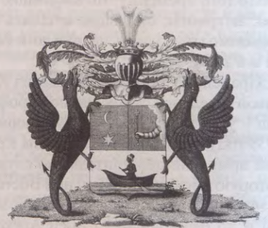
ГЕРБЪ РОДА АРАПОВЫХЪ.