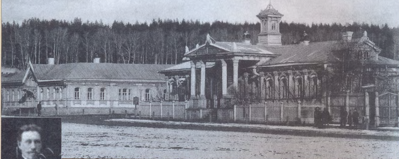
Мелекес. Начальное училище имени Александра II