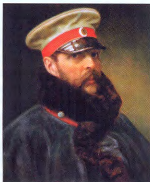
Портрет императора Александра II. 1865