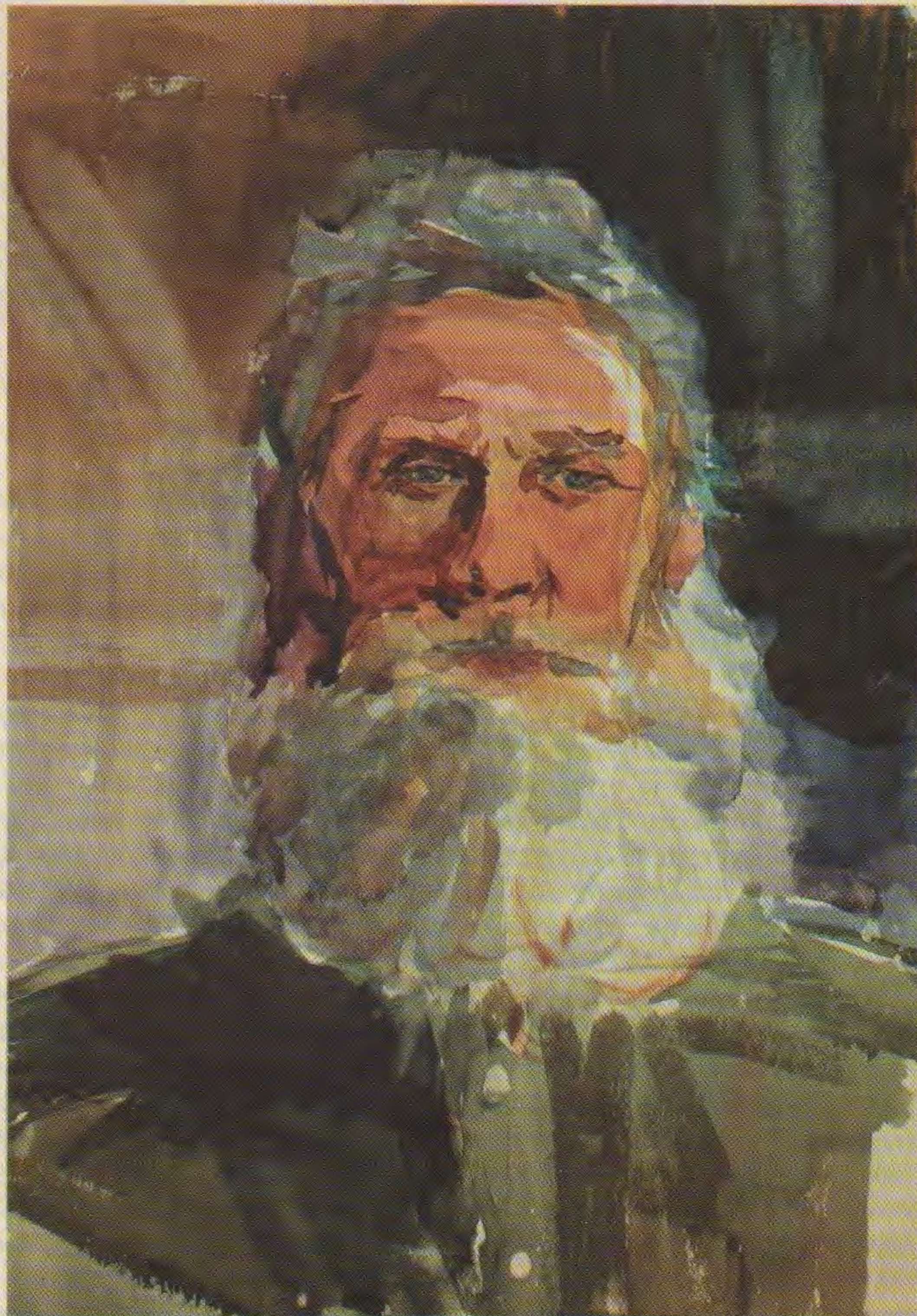
Н.П. Облезин. Портрет отца. Из собрания семьи Облезиных