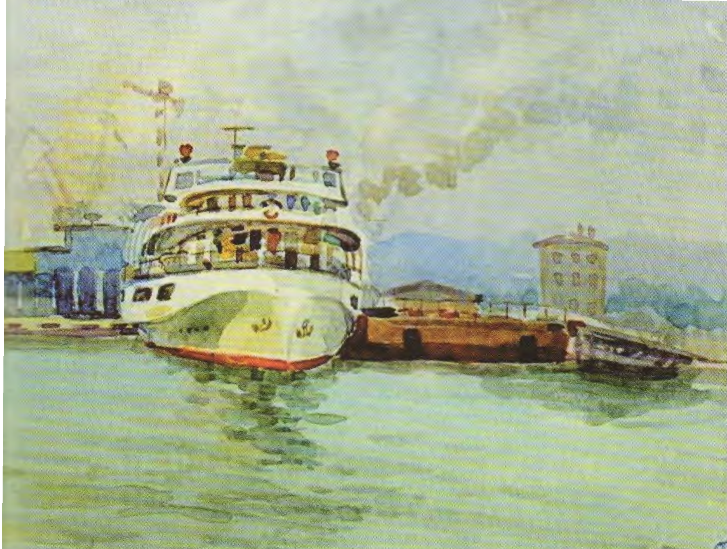
• Н.П. Облезин. Старый речной вокзал. Из собрания семьи Облезиных

в творчество, тем более что Вы – Мастер!!!». Он не вернулся. Но возвращаются его картины.