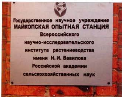
На Майкопской опытной станции работал правнук Д.В. Давыдова