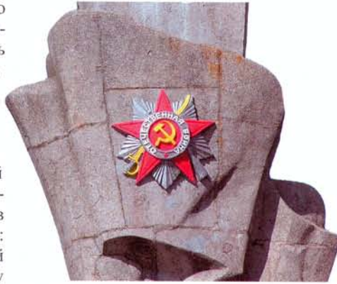
Памятник защитникам Отечества в Адыгее

Был награждён медалями «За оборону Кавказа», «За Победу над фашистской Германией в 1941–1945 годы».