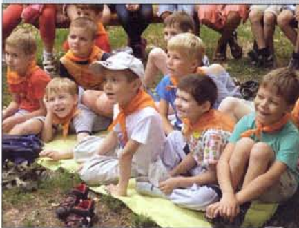
Читальня на траве

С ноября 2007 года библиотека носит имя Сергея Тимофеевича Аксакова. В 2008 году по инициативе Губернатора Ульяновской области – Председателя Правительства С.И. Морозова был создан Ульяновский фонд поддержки детского чтения.