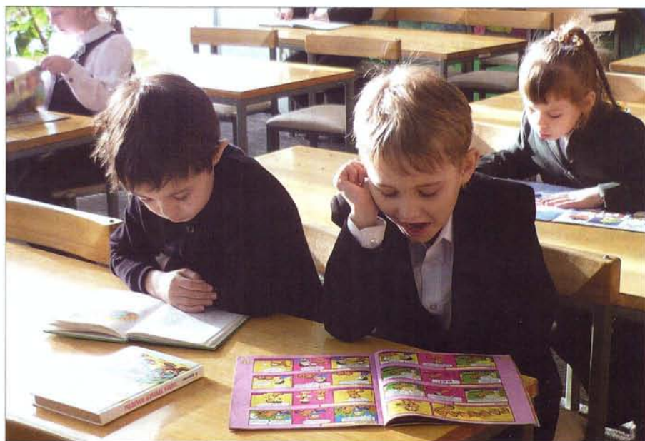
Иллюстрируем сказки Н.М. Карамзина

А сейчас каждый день в «Аксакову» спешат мальчишки и девчонки, для многих она стала домом, куда хочется приходить вновь и вновь.