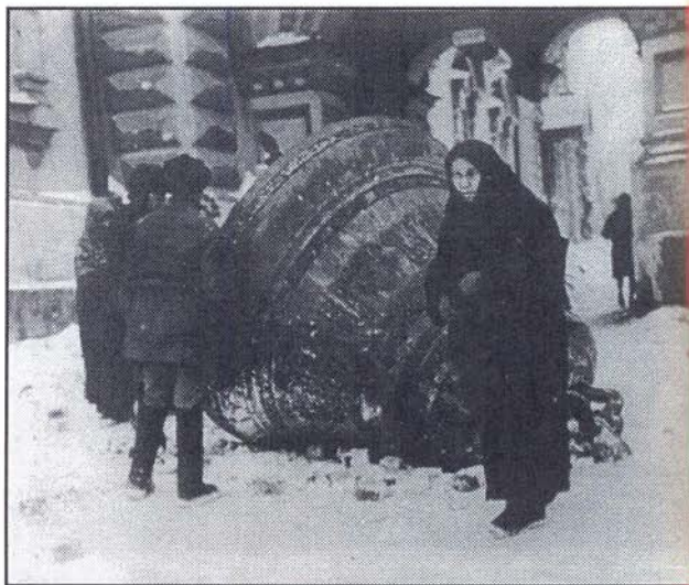
Колокол, сброшенный с Богоявленской церкви (из архива А. С. Сытина).