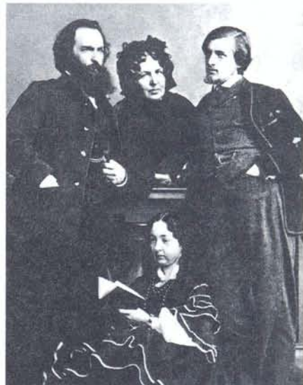
В. Каррик с членами семьи

В 1871 и в 1875 годах Вильям Каррик совершил две экспедиции по Волге от Нижнего Новгорода до Симбирска. В первой экспедиции его сопровождал Мак-Грегор. Сделав несколько непродолжительных остановок в различных приволжских городах и сёлах, друзья