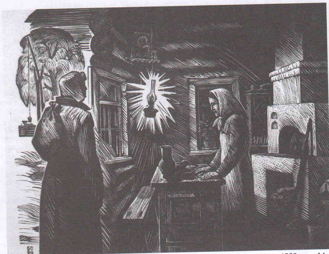
Склярук Б.Н. 1937 г. Иллюстр. к рассказу «Русский характер» А. Толстого. 1982. ксл. 14x18