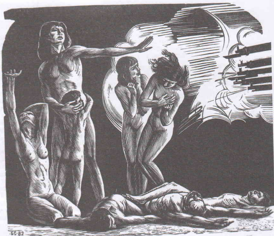
Склярук Б.Н. 1937 г. Бабий Яр, Сонгми, Сабра и Шатила... 1982. ксл. 13,5x16