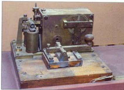
Телеграфный аппарат системы Морзе. Начало XX века

До 1864 года телеграфная станция размещалась в здании по Троицкому переулку (ныне – переулок Краснознамённый).