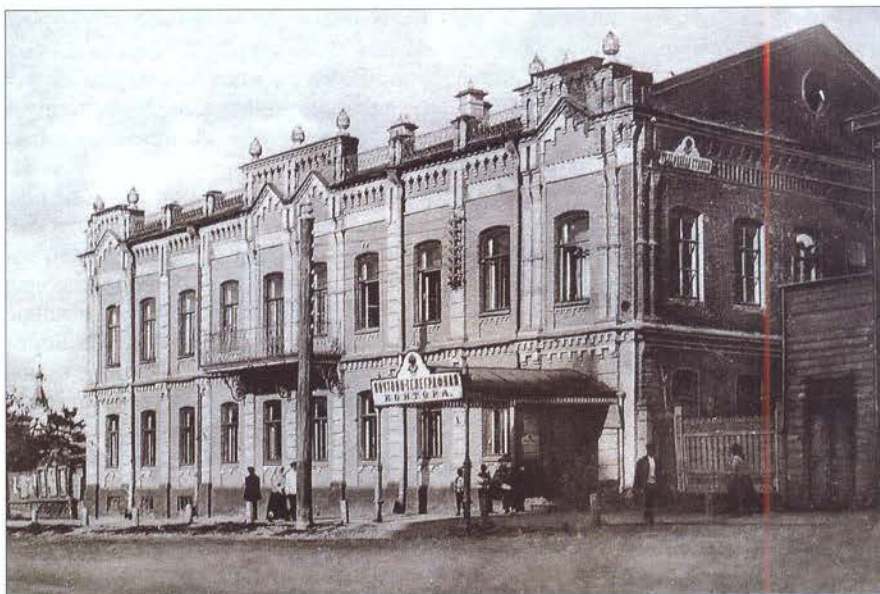
Симбирск. Почтово-телеграфная контора

К середине 90-х годов позапрошлого века за пределами города шло строительство большого комплекса Карамзинской больницы, которую требовалось связать телефоном с губернскими и земскими органами власти. В начале 1895 года эта линия заработала, положив начало междугородной телефонной связи в губернии. К 1900 году таких линий было