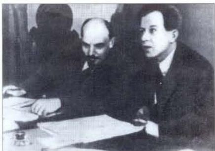
В.И. Ленин и Фриц Платтен в президиуме I конгресса Коминтерна. Март 1919 года

Отъезд головной группы швейцарцев с вокзала в Цюрихе. 17 марта 1924 года