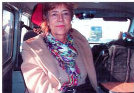
Швейцарские кинодокументалисты на ульяновской земле и автор статьи (на фото внизу, слева). 2013

Фильм будет показан в немецкоязычных странах, в России, его можно будет увидеть в Интернете. Планируемая продолжительность фильма – 50 минут. Помимо кадров, отснятых в Ульяновской области, будут включены отрывки из кинохроники событий, в которых принимал участие Фриц Платтен. Больше всего швейцарских документалистов удивило то, что архив О.В. Свенцицкой и Дружининых, который они «долго и упорно искали в Москве», оказался в русской глубинке. Они отметили, что были тронуты тем, с какой любовью в России хранят память о Ф. Платтене и швейцарских коммунарах. Наши гости остались «совершенно довольны съёмками в России», рады позитивным переменам в русской деревне по сравнению с тем, что они видели во время съёмок в 1990-е годы.