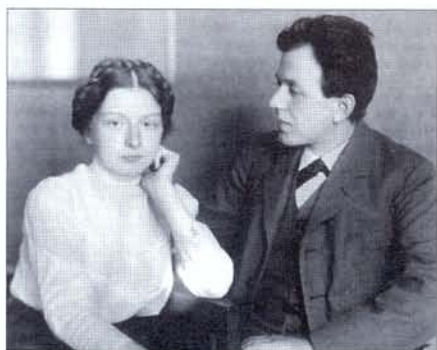
Фриц Платтен с женой Ольгой. 1912