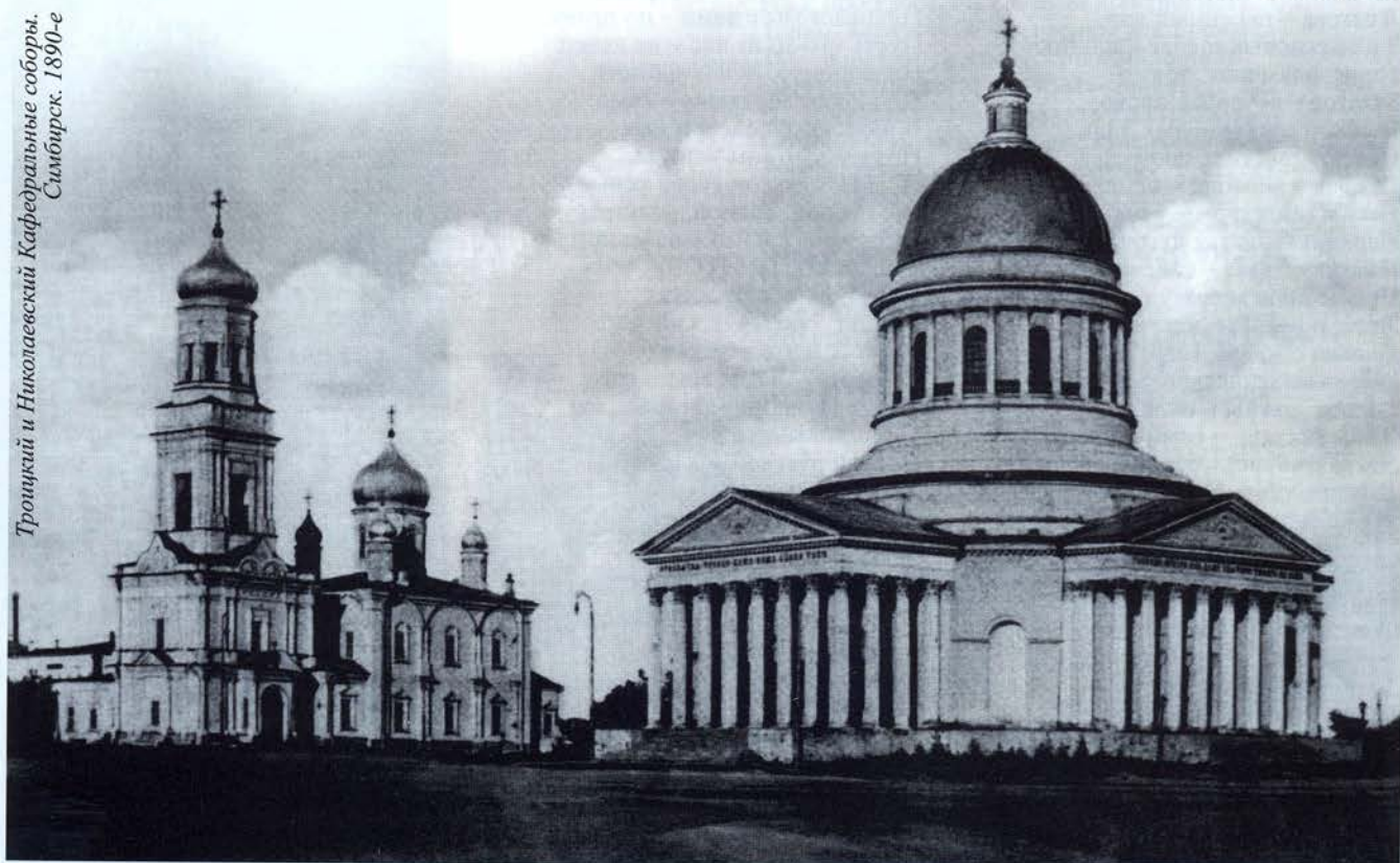
Троицкий и Николаевский Кафедральные соборы, Симбирск. 1890-е