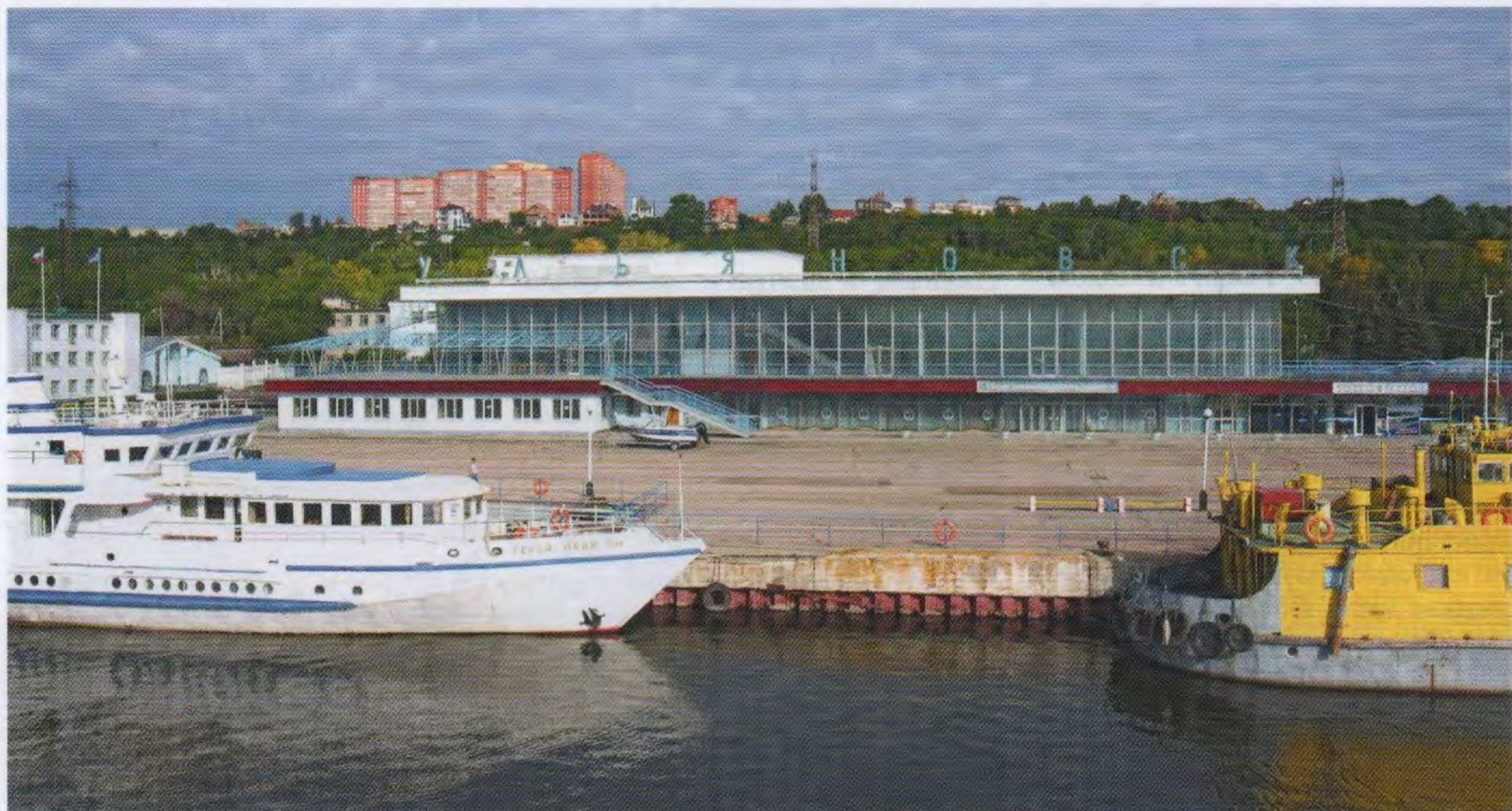
Речной вокзал со стороны Волги.

29 мая 2020 года зданию речного вокзала в Ульяновске исполнилось 55 лет.