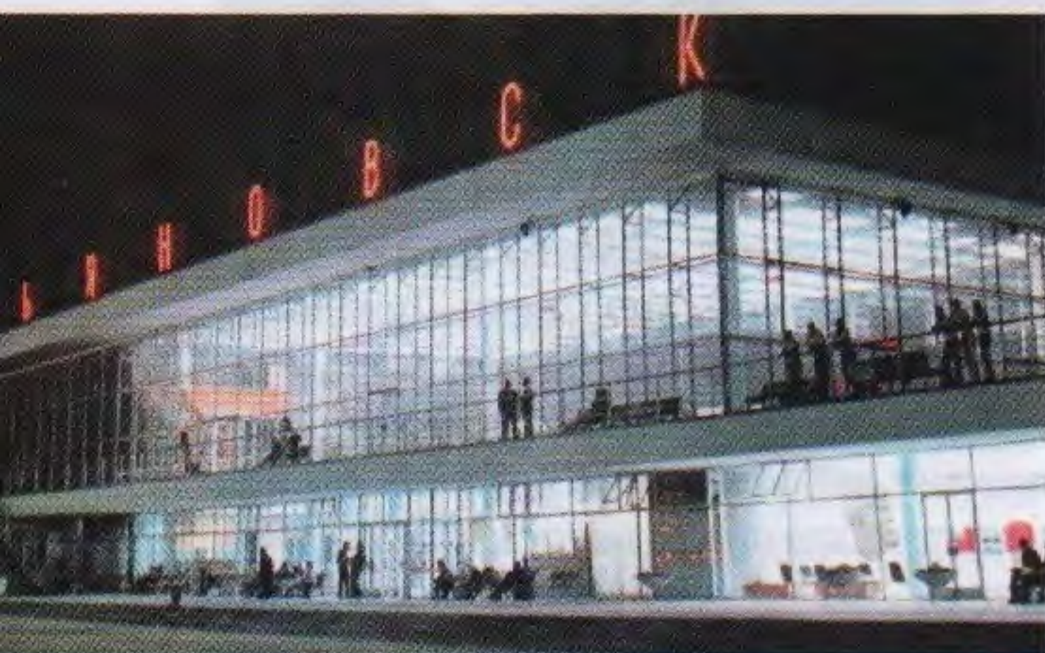
Здание речного вокзала в сумерках. «Градостроительство СССР. 1917–1967», М., Стройиздат, 1967

Великая русская река Волга дает силу нашему городу, создает особый дух места. Тихо течет Волга, и вместе с ней течет время, сменяются эпохи, поколения, года. Многие на своем веку повидала эта могучая река: революцию, перемены, страшную войну, затем – оттепель, эпоху подъема.