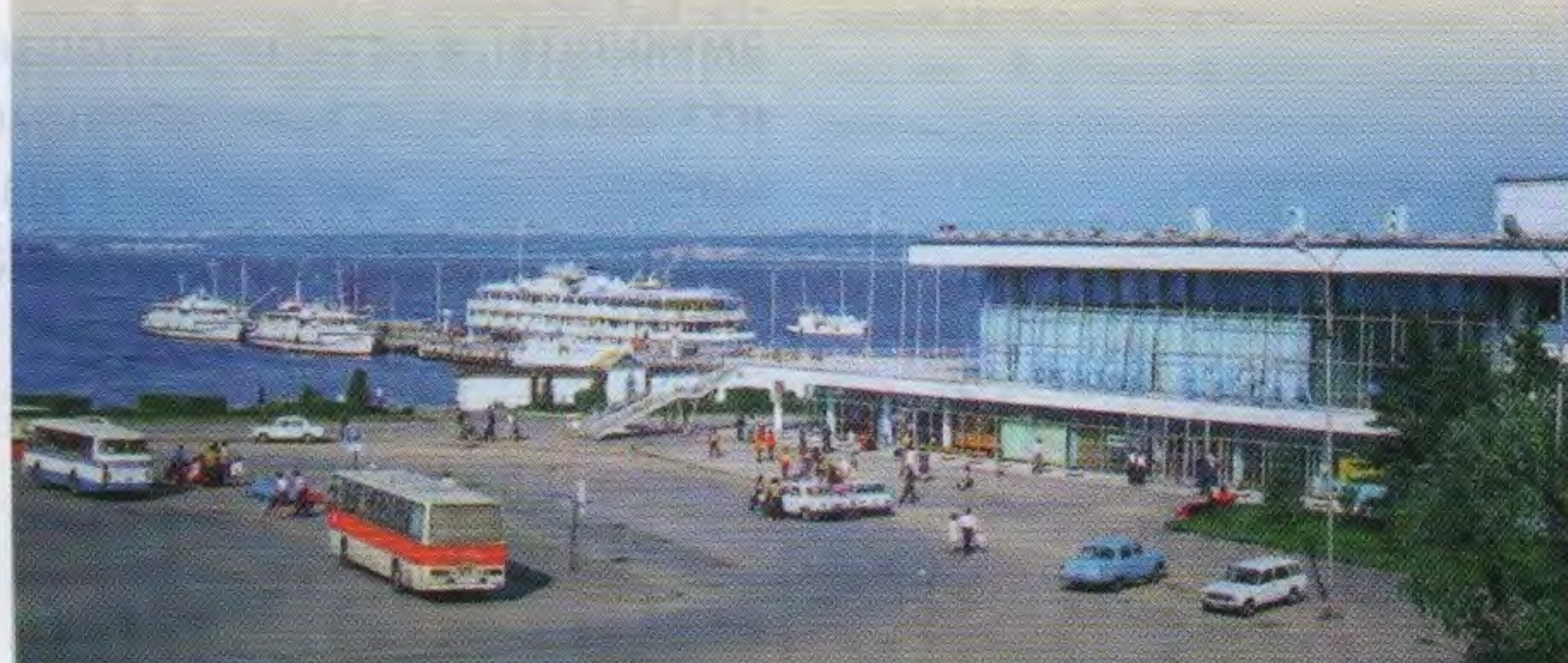
Речной вокзал с пароходами. Ульяновск: Альбом, автор-составитель С.П. Волошин – Саратов: Приволжское кн. изд. 1990

алюминиевые витражи и решетки для подвесного потолка. Во внутренней отделке широко использовалось дерево – с этой работой успешно справилась Ульяновская мебельная фабрика. За многие километры видны над зданием металлические двухметровые буквы, составляющие имя нашего города. Они изготовлены коллективом УльГЭС по чертежам и под руководством мастера Г.П. Борисова. Об этом сообщалось в статье «Ульяновский речной порт накануне открытия» в газете «Ульяновская правда» от 26 мая 1965 года.