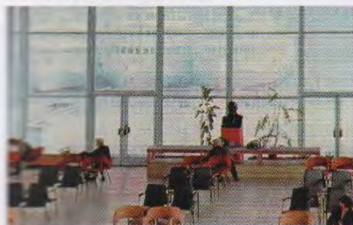
«Ульяновск», комплект из 15 открыток, издательство «Планета». 1985

Издали оно казалось хрустальным, необычным, праздничным. С красивыми архитектурными, выразительными формами и изящной отделкой. Построено здание речного вокзала по проекту «Ленгипроречтранс» с использованием модных новинок: это сочетание железобетона, алюминия, стекла и пластика.