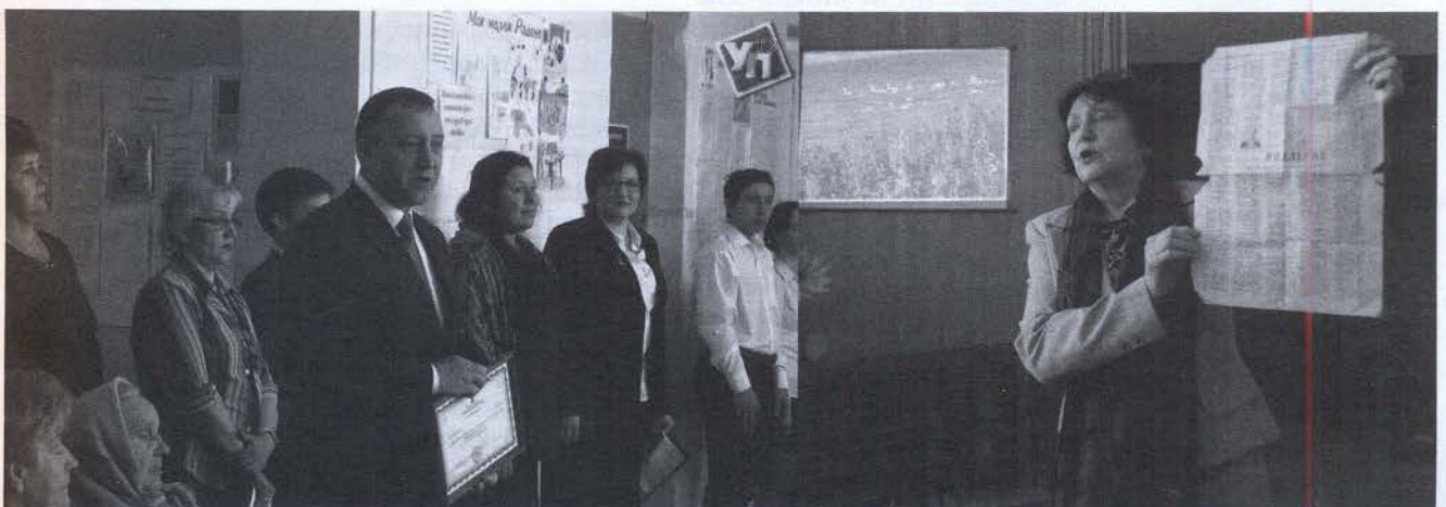
Торжественная линейка. Выступает глава администрации Радищевского района Александр Белотелов