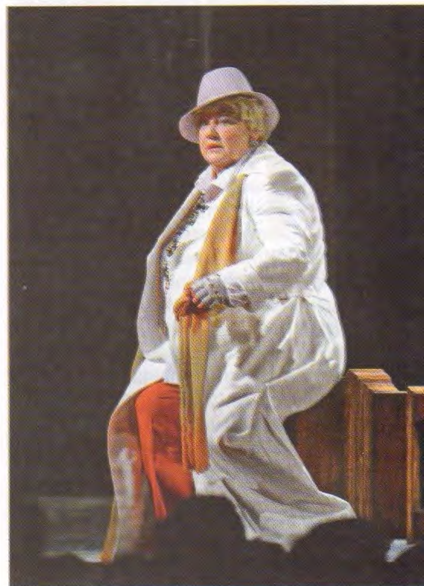
Бабушка (Эрик-Эмманюэль Шмитт. «Если начать сначала»)

Работа для актёра – это жизнь, это лекарство. Особенно это чув-