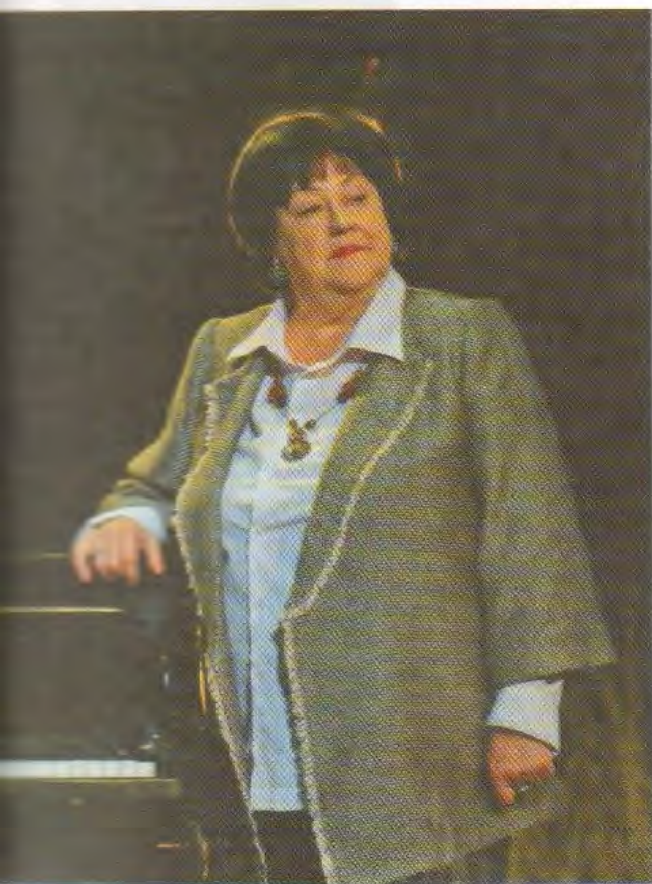
Геката (У. Шекспир «Макбет»)