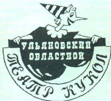
Первая эмблема театра

навес ручной работы. А чтобы это все было воплощено в жизнь как можно скорее, горожане и предприятия собрали почти 2 миллиона рублей. И теперь восхищенные лица и восторженные глаза детей, входящих в зал Кукольного храма, будут живо напоминать счастливый финал сказки Алексея Толстого "Золотой ключик" - Новый Театр дает Свое Первое Представление.