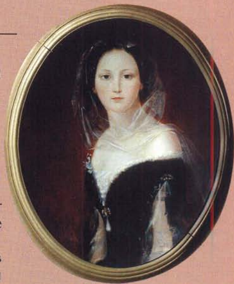
Портрет Е.В. Толстой работы Н.А. Майкова. 1855

Два романа развивались параллельно: один роман Гончаров переживал и излагал в письмах к Е.В. Толстой, другой, роман «Обломов», творил в форме литературного произведения, но также во имя её.